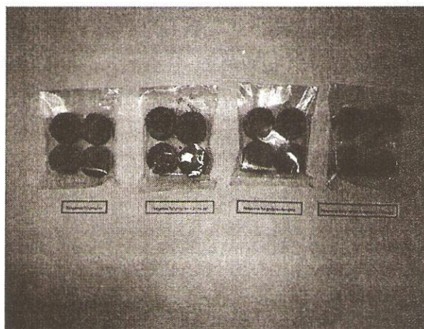
Gambar 2. Gula kelapa beriodium. A. kontrol, B. fortifikasi Nal, C. fortifikasi KI, D. fortifikasi KIO 3