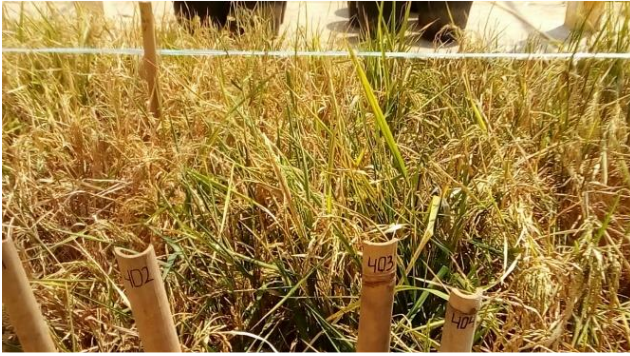
Gambar 3. Penampilan tanaman mengering

bahwa pada kondisi kekeringan fungsi daun bendera sangat penting dalam proses pengisian gabah, terutama peranannya dalam menjaga sintesis dan transport asimilat.