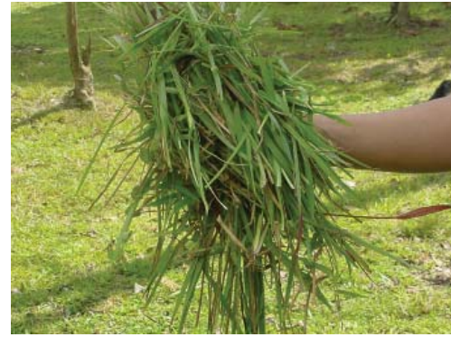
Rumput lapang ( Axonopus compressus )