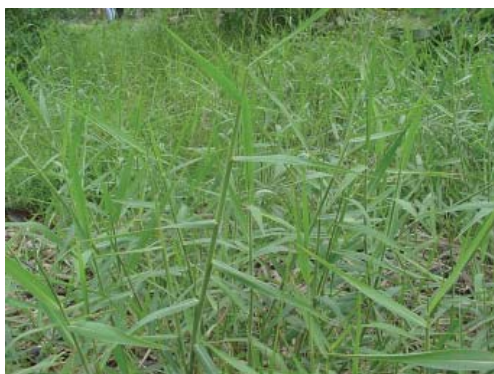
Rumput kolonjono ( Cynodon dactylon )