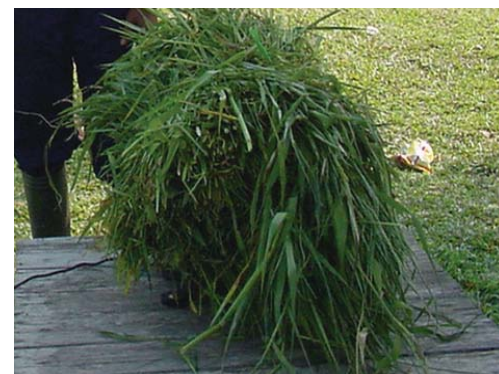
Rumput kumpai ( Hyampeacne amplexicaulis )