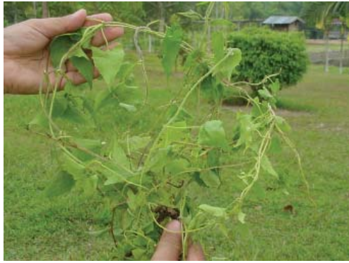
Daun cabe-cabe ( Asystasia spp)