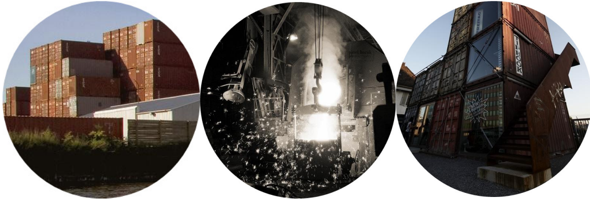
Gambar 2. Wasted or Recycled or Architecture?

Kontainer adalah peti atau kotak yang memenuhi persyaratan teknis sesuai dengan International Organization for Standardization (ISO) sebagai alat atau perangkat pengangkutan barang yang bisa digunakan diberbagai moda, mulai dari moda jalan dengan truk kontainer, kereta api kontainer dan kapal kontainer untuk moda laut. Ciri khas sebuah kontainer adalah memiliki pintu yang dipasang di salah satu ujung, dan badan kontainer dibuat dari pelat logam anti korosi ( cor-ten steel ) bergelombang. (Smith, J.D., 2006)