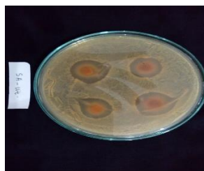
Gambar 2: Lebar daerah hambat ekstrak serbuk kering daun F. decipiens terhadap bakteri S. aureus

Data hasil uji aktifitas inhibisi ekstrak daun kiara payung terhadap bakteri S aureus menunjukkan bahwa baik ekstrak daun segar maupun ekstrak daun kering memiliki F. decipiens memiliki efektifitas yang cukup tinggi sebagai agen anti bakteri berdasarkan ketentuan McDermott dan Hartley (1989) sebagai berikut: