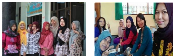
Gambar 1. Peserta pelatihan

Pada pelaksanaan kegiatan, peserta pelatihan menunjukkan sikap antusias yang relatif besar. Hal ini terlihat pada ketertarikan mereka pada materi yang disampaikan. Sikap antusias juga terlihat pada pertanyaan yang diajukan pada pemateri pada saat sesi diskusi atau sesi tanya jawab. Pertanyaan peserta umumnya terkait dengan make up wajah dan pemilihan perlengkapan yang sesuai dengan kondisi tubuh atau wajah mereka.