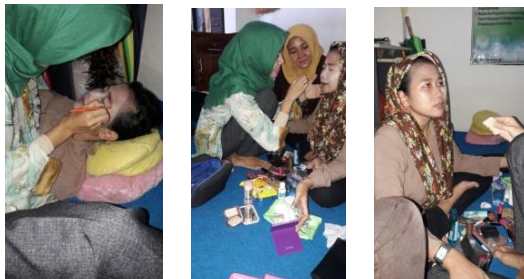
Gambar 2. Sesi praktek

adanya keinginan untuk melihat proses merias dari dekat secara bergantian. Dengan pengamatan dari jarak dekat maka peserta dapat mengetahui detail-detail tata rias secara lebih jelas dibandingkan jika melihat dari buku atau tayangan media lain.