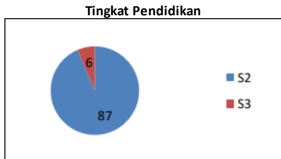
Diagram 1. Penyebaran Dosen dalam Tingkat Pendidikan

Sedangkan untuk jenjang jabatan fungsional, 30 orang asisten ahli (32,3%), 26 orang lektor (27,9%), dan 12 orang lektor kepala (12,9%), 1 orang guru besar (1,1%), dan lainnya sebanyak 24 orang belum memiliki jabatan fungsional akademik (25,8%).