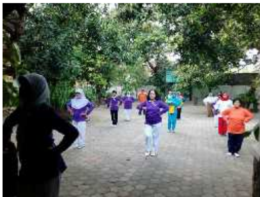
Gambar 1. Kegiatan motoric lansia

Pada pelaksanaan yang kedua para peserta diajak melakukan aktivitas ringan bersama. Para peserta diajak senam dengan pelatih senam. Berikut ini adalah foto kegiatan aktivitas motoric sederhana para peserta posyandu lansia :