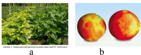
Gambar 2. 1. Tumbuhan cabe dan tomat yang terserang virus