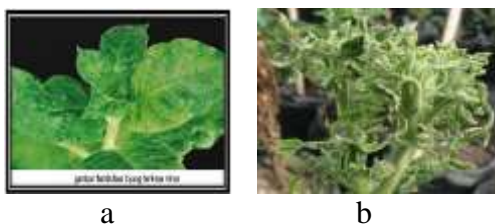
Gambar 2.2. Morfologi daun yang menggulung pada tumbuhan yang terserang virus