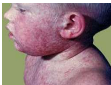
Gambar 2.5. Anak yang terinfeksi virus campak

Campak adalah infeksi saluran pernafasan yang disebabkan oleh virus, penyakit campak mudah menular dan sering menyerang anak-anak, terutama dengan kondisi kurang gizi. Penyakit campak disebabkan oleh virus paramyxovirus yang memasuki tubuh melalui saluran pernapasan bagian atas. Anak yang terinfeksi penyakit campak, dapat dilihat pada gambar 2.5