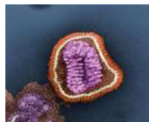
Gambar 2. 3. Virus influenza, dilihat dengan mikroskop elektron.

Influenza merupakan penyakit yang dapat menjangkit dengan cepat di lingkungan masyarakat. Penyebab Influenza adalah virus golongan Orthomyxovirus yang berbentuk seperti bola. Virus influenza ditularkan lewat udara dan masuk ke tubuh manusia melalui alat pernafasan. Virus influenza pada umumnya hanya menyerang sistem pernafasan terutama ditandai oleh demam, menggigil, sakit otot dan sakit kepala. Lamanya sakit berlangsung antara 2-7 hari dan biasanya sembuh sendiri. Yang paling penting menghadapi influenza adalah pencegahan dengan cara memberi kekebalan terhadap infeksi virus yang homolog, kekebalan yang diperoleh melalui vaksin sekitar 70%. Virus influenza dapat dilihat pada 2.3