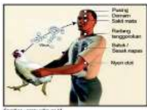
Gambar 2. 4. Proses penularan flu burung ke manusia,