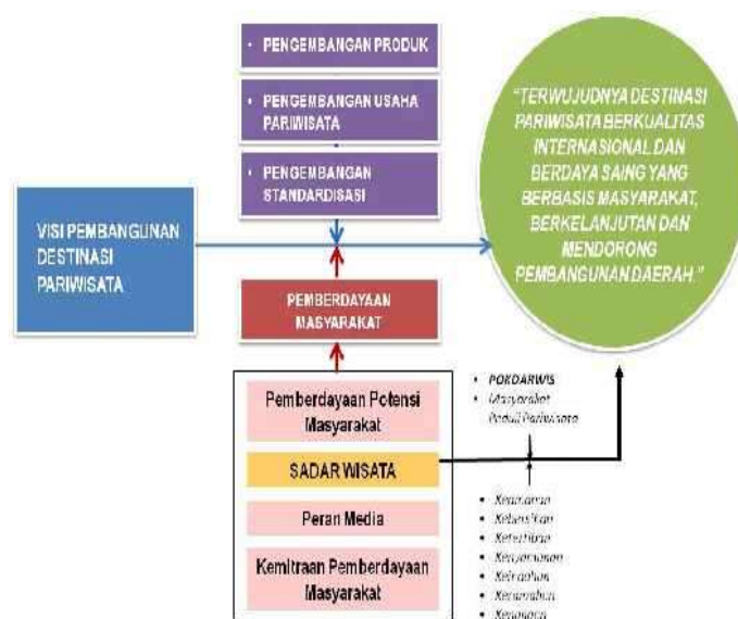
Gambar 2. Peran dan Posisi Penting Kelompok Sadar Wisata (Pokdarwis)

Gambaran posisi dan peran penting Kelompok Sadar Wisata (Pokdarwis) dikaitkan dengan pengembangan kepariwisataan / destinasi pariwisata tersebut dapat diilustrasikan pada Gambar 2 di bawah ini: