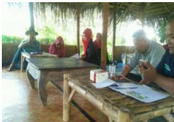
Gambar 8. Penyampaian Materi Manajemen Keuangan dan Pemasaran