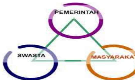
Gambar 1. Pemangku Kepentingan dalam Pembangunan Pariwisata

Pembangunan kepariwisataan, sebagaimana halnya pembangunan di sektor lainnya, pada hakekatnya melibatkan peran dari seluruh pemangku kepentingan yang ada dan terkait. Pemangku kepentingan yang dimaksud meliputi 3 (tiga) pihak yaitu: Pemerintah, Swasta dan Masyarakat, dengan segenap peran dan fungsinya masing - masing. Masing-masing pemangku kepentingan tersebut tidak dapat berdiri sendiri, namun harus saling bersinergi dan melangkah bersama-sama untuk mencapai dan mewujudkan tujuan dan sasaran pembangunan yang disepakati. Gambar 1. dibawah ini menunjukkan keterkaitan dan sinergi antar pemangku kepentingan dalam kegiatan pembangunan kepariwisataan.