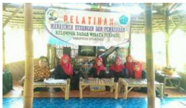
Gambar 5. Tim Pengabdian Masyarakat