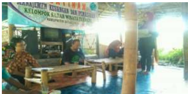
Gambar 4. Pembukaan Oleh Moderator

Jumlah keseluruhan pokdarwis yang berada di wilayah Kabupaten Situbondo sebanyak 21 dan telah menerima undangan dari kami untuk menghadiri acara pelatihan. Namun yang hadir pada acara tersebut hanya ada 10 pokdarwis yaitu, Pokdarwis Tampora, Pokdarwis JMK, Pokdarwis Kalianget, Wisata JBS, Pokdarwis Kp. Blekok, Pokdarwis Agol, Pokdarwis Mimbaan, Pokdarwis Ollean, Pokdarwis Suboh dan Pokdarwis Kendit.