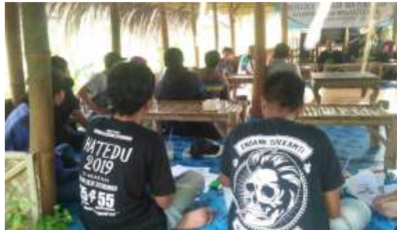
Gambar 9. Pengisian test case

Disini kami menyampaikan mengenai 3 materi yakni materi pengembangan sumber daya manusia (SDM) tentang bagaimana cara mengembangkan SDM yang ada dengan baik, penyampaian materi Keuangan agar masyarakat bisa tau mengenai kas masuk dan kas keluar serta bisa menulis laporan keuangan menggunakan Ms.Word dan Ms.Excel. Disini kami juga menjelaskan tentang materi Manajemen Pemasaran agar mereka mengetahui bagaimana strategi yang tepat untuk mempromosikan pariwisata yang berada di kabupaten Situbondo.