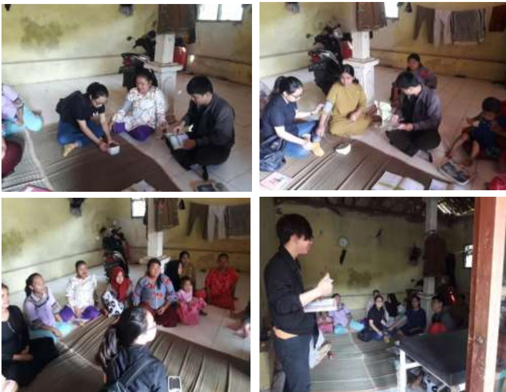
Gambar 6. Proses Edukasi dan Pendampingan Akuntansi Posyandu Nusa Indah (Kp. Lebaksari, Rt. 10/05, Ds. Mekarwangi, Kec. Cisauk)

Posyandu Rambutan berlokasi di Kampung Pasir Awi, Rt. 14, Rw. 005, Desa Mekarwangi, Kecamatan Cisauk, Kabupaten Tangerang. Kegiatan di Posyandu Rambutan berisi Posyandu untuk Ibu Hamil, Batita dan Balita serta dimulai dari pukul 07.30-13.30 WIB dengan pelayanan 4 Kader dan 1 Bidan Desa. Adapun jarak tempuh antara Universitas Matana menuju Posyandu Rambutan sejauh 19,4 km dengan waktu tempuh mencapai 41 menit dikarenakan jalan yang kurang baik. Proses pendampingan pembukuan yang dilakukan di Posyandu Rambutan ini dilakukan melalui proses rekapitulasi semua aspek pencatatan posyandu yang meliputi nama anak kandung, nama ibu, berat badan, umur, peningkatan dan penurunan berat badan, jenis kelamin, dan pemberian imunisasi dan diakhiri dengan proses pendampingan pelaporan ke beberapa format berikut ini: Format 1 (Ibu Hamil), Format 2 (Balita di bawah 1 tahun) dan Format 3 (Balita di atas 1 tahun). Adapun proses edukasi dan pendampingan akuntansi lebih lengkap telah dijelaskan dalam Gambar 5 di atas.