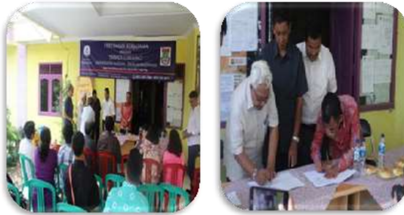
Gambar 1. MoU Universitas Matana-Desa Binaan

Adapun kegiatan rutin yang sudah dilakukan, khususnya di Program Studi Akuntansi, di antaranya adalah pembelajaran akuntansi dasar di SDN Mekarwangi, Cisauk, Kab. Tangerang (Effendi, 2018), pendampingan akuntansi Bendahara dan Pengajar SDN Mekarwangi, Cisauk, Kab. Tangerang (Effendi, 2018) dan kegiatan di tahun 2019 ini yang sedang berjalan adalah pendampingan pembukuan P2WKSS Cilegong Khususnya di Seluruh Posyandu Se-Desa Mekarwangi. Selain kegiatan rutin, terdapat juga kegiatan yang bersifat insidental yang sudah dilakukan seperti bimbingan dan pelatihan akuntansi dan pajak untuk siswa kelas XII Ak di SMK Dharma Widya, Neglasari, Tangerang-Banten (Effendi, 2018).