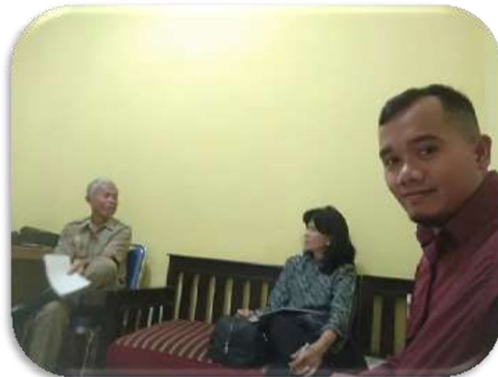
Gambar 3. Proses Peninjauan Kebutuhan Bersama PKM

Berdasarkan hasil peninjauan kebutuhan bersama yang dilakukan pada tanggal 13 Agustus 2019 bertempat di Desa Mekarwangi antara LPPM dan Dosen Akuntansi Universitas Matana dengan Sekretaris Desa Mekarwangi diperoleh keputusan kebutuhan pendampingan akuntansi tahap 1 dilaksanakan di dua Posyandu Desa Mekarwangi yakni Posyandu Rambutan dan Posyandu Nusa Indah. Proses peninjauan kebutuhan bersama sebagaimana dijelaskan pada Gambar 3.