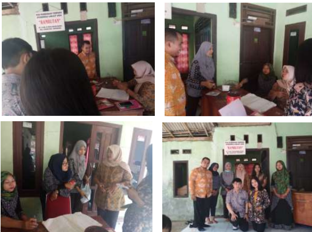
Gambar 5. Proses Edukasi dan Pendampingan Akuntansi Posyandu Rambutan (Kp. Pasir Awi, Rt. 14/05, Ds. Mekarwangi, Kec. Cisauk)

Kegiatan pengabdian kepada masyarakat melalui kegiatan edukasi dan pendampingan akuntansi di Posyandu Rambutan dan Posyandu Nusa Indah ini dilakukan melalui kegiatan pendampingan terkait dengan proses pencatatan pembukuan (akuntansi) Posyandu dari mulai proses pendataan peserta Posyandu hingga proses pelaporan baik terkait informasi keuangan dan informasi non keuangan ke Puskesmas dan Desa Mekarwangi. Tujuan dari kegiatan pendampingan dalam Posyandu ini adalah untuk meningkatkan pemahaman memadai mengenai pembukuan (akuntansi) bagi Para Kader Posyandu dalam proses pencatatan dan pembukuan yang efektif dan efisien. Selanjutnya, kegiatan pendampingan ini juga bertujuan untuk meningkatkan kecepatan dan keakuratan pelaporan pembukuan bagi Para Kader Posyandu baik informasi keuangan maupun non keuangan untuk pihak internal dan pihak eksternal.