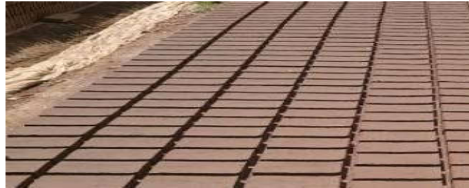
Gambar 3 Proses pengeringan