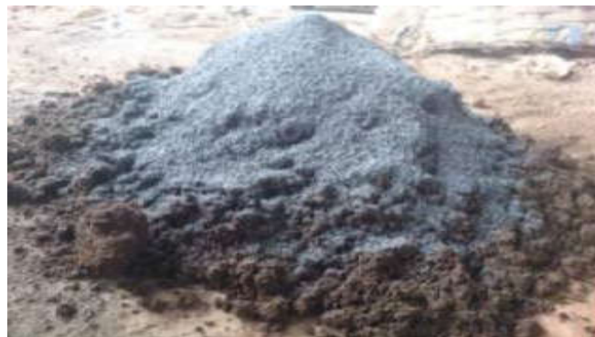
Gambar 1 Campuran abu dengan tanah liat

“ Karakteristik kualitas adalah produk yang menarik, semakin besar maka semakin baik, misalkan pada kuat tekan “ (Soejanto, 2009). “karakteristik kualitas pada batu bata yang digunakan pada penelitian ini menggunakan Larger The Better. Karakteristik ini diperlukan sebagai peningkatan kualitas dengan standar kuat tekan diatas 2,5 Mpa pada kelas batu bata M-5 dan M-6 “ (SNI 15-2094, 2000). Sehingga penelitian ini dapat menghasilkan setting level yang optimal.