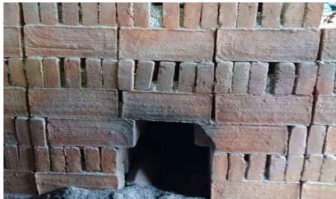
Gambar 4 Setelah pembakaran