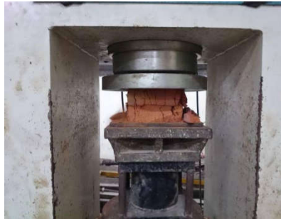
Gambar 6 Setelah pengujian kuat tekan