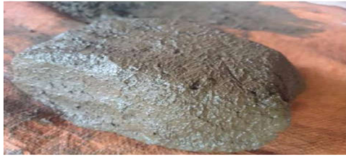
Gambar 2 Sudah bentuk lumpur siap cetak