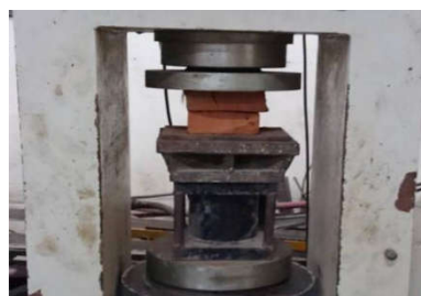
Gambar 5 Sebelum pengujian kuat tekan

“ Dari tabel 2 dan 3 Rata-rata uji kuat tekan batu bata pada eksperimen 1, 4, dan 7 pada variasi jobmix 2,5%. Dan hasil uji kuat tekan campuran abu serat sabut tebu pada eksperimen 1 dengan kuat tekan 1,9325 Mpa, eksperimen 4 dengan kuat tekan 1,9275 Mpa, dan eksperimen 7 dengan kuat tekan 1,9625Mpa. Dan hasil uji kuat tekan campuran abu serbuk gergaji pada eksperimen 1 dengan kuat tekan 2,6950 Mpa, eksperimen 4 dengan kuat tekan 2,7025 Mpa, dan eksperimen 7 dengan kuat tekan 2,6850 Mpa.