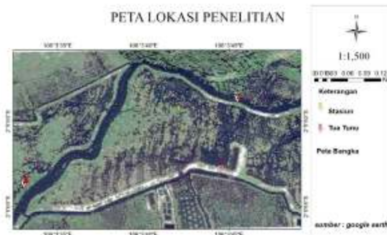
Gambar 1. Lokasi Penelitian Pengambilan Sampel Ikan

Adapun alat dan bahan yang digunakan dalam penelitian dapat dilihat pada Tabel 1.