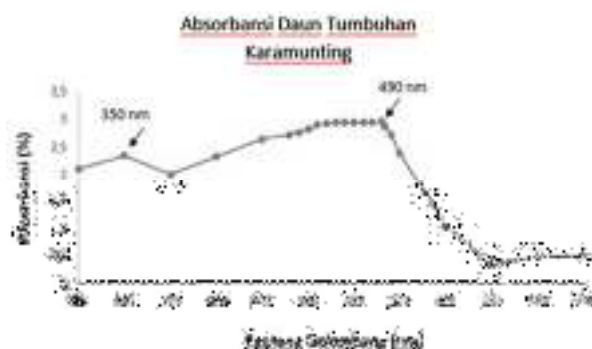
Gambar 1. Absorbansi Ekstrak Daun Karamunting

Pemanfaat ekstrak tumbuhan karamunting sebagai DSSC terlebih dahulu dengan mengetahui kemampuannya dalam mengabsorpsi cahaya matahari. Untuk mengetahui absorbansi larutan dye ekstrak maka dilakukan karakterisasi absorbansi dengan menggunakan spektrometer UV. Hasilnya ditunjukkan oleh gambar 1.