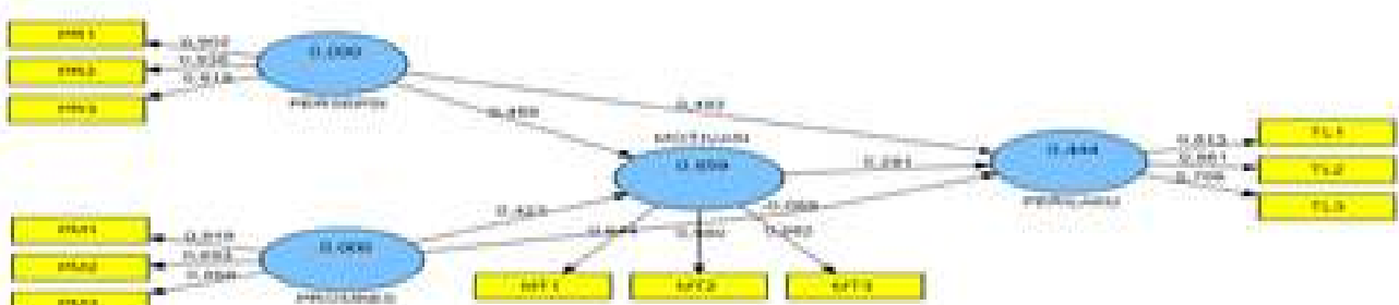
Gambar 2 Model Penelitian Pengaruh langsung dan tidak langsung persepsi tentang penyakit, promosi kesehatan dan motivasi terhadap perilaku pencegahan kanker serviks pada bidan

Berdasarkan gambar 2, dapat dijelaskan bahwa