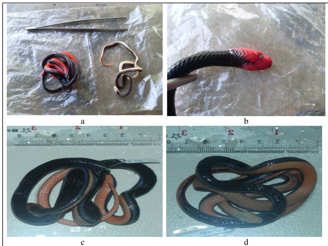
Gambar 22. Maticora bivirgata flaviceps (Cantor, 1839) a. Sebelum dan Sesudah Diawetkan, b. Kepala, c. Dorsal, d. Ventral.

Sesuai dengan yang dideskripsikan oleh Cox et al. , (1998): ekor dan kepala berwarna merah, badan berwarna biru gelap berkilau, terdapat garis biru sepanjang tepi badan dan bagian ventral berwarna merah. Ular ini memiliki panjang 1400 mm.