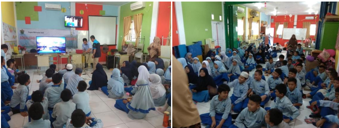
Gambar 3. Kegiatan Sosialisasi Mitigasi Bencana Geologi di SDIT Ar-Rahmah Makassar