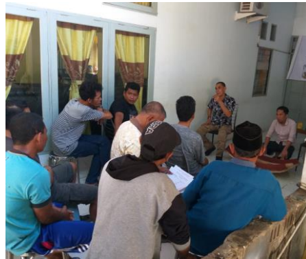
Gambar 4. Pemaparan teori pembuatan pola gading baja oleh tim pengabdian

Pelaksanaan kegiatan pengabdian ini melibatkan 12 pengrajin kapal kayu. Pada tahap pertama dari kegiatan ini, dilaksanakan pemaparan teori pembuatan pola gading baja dari konstruksi lambung kapal kayu yang sudah dibangun (Gambar 4).