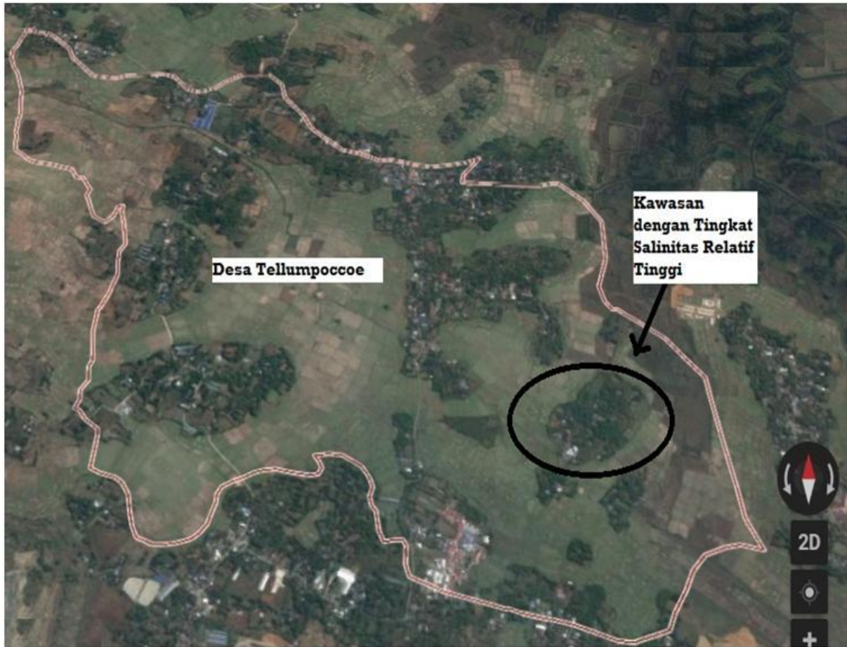
Gambar 1. Daerah dengan Tingkat Salinitas Tinggi

Selain kandungan dari air yang tersedia, data sebelumnya juga memperlihatkan tingkat salinitas yang tinggi, sehingga pemilihan solusi yang ditawarkan hendaknya mengakomodasi permasalahan tersebut. Berikut Gambar 1 memperlihatkan kawasan pada Desa Tellumpoccoe yang diperkirakan mengandung kadar salinitas yang tinggi.