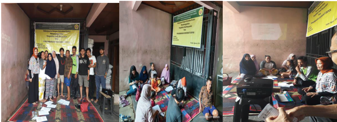
Gambar 2. Foto Pelaksanaan Kegiatan

Luaran yang diinginkan dari pengabdian kepada masyarakat ini adalah adanya solusi bagi pelaku usaha tahu dalam memiliki karakter wirausaha sehingga usaha yang dikelola mengalami perkembangan dan dapat dijadikan usaha formal yang pada akhirnya dijadikan UKM binaan oleh Bank Jabar.