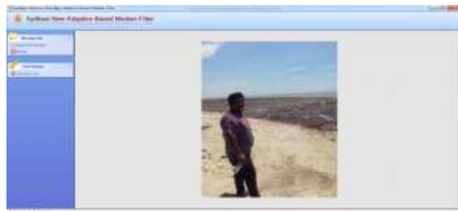
Gambar 8. Hasil Perbaikan Noise

Gambar 7 menampilkan noise pada seluruh citra, untuk memperbaiki noise masih dilakukan dengan cara yang sama dan didapat hasil sebagai berikut: