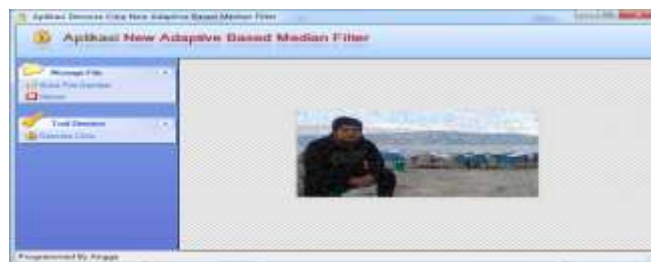
Gambar 5. Citra sebelum diperbaiki

Pada tampilan program diatas terdapat beberapa sub menu dan frame yang terdiri beberapa pengaturan yang bisa digunakan untuk mengatur restorasi pada gambar. Sub menu ini digunakan untuk melakukan perbaikan pada gambar yang mengandung noise. Sebagai contoh proses perbaikan penulis menggunakan gambar penulis yang sudah diberikan noise menggunakan matlab, berikut hasilnya