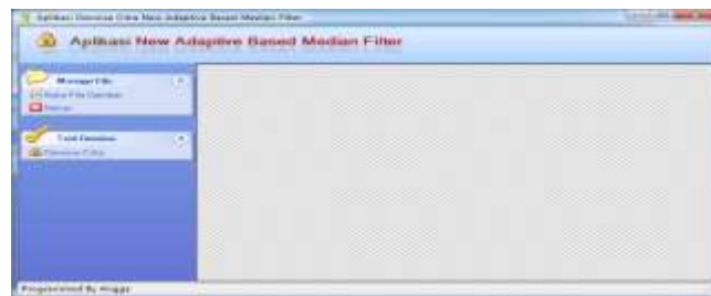
Gambar 4. Tampilan Form Utama

Tampilan pertama program begitu dijalankan adalah seperti gambar di bawah ini.