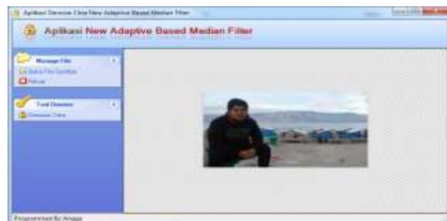
Gambar 6. Citra setelah diperbaiki

Gambar 5. merupakan contoh pengujian yang dilakukan untuk mereduksi noise (denoise) pada citra, untuk melakukan proses denoise bisa dilakukan dengan memilih tool denoise citra, berikut adalah hasil proses denoise citra dari gambar 5