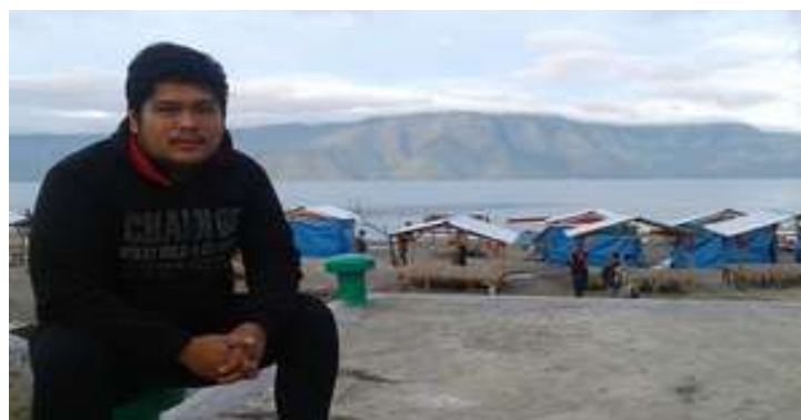
Gambar 3. Hasil Perbaikan Noise

Analisa proses algoritma yang penulis bahas diatas merupakan beberapa bahagian saja dan untuk nilai pixel lainnya bisa dilakukan dengan cara yang sama dengan langkah proses diatas hingga semua nilai n pixel diproses sehingga hasil perbaikannya seperti tampak gambar berikut: