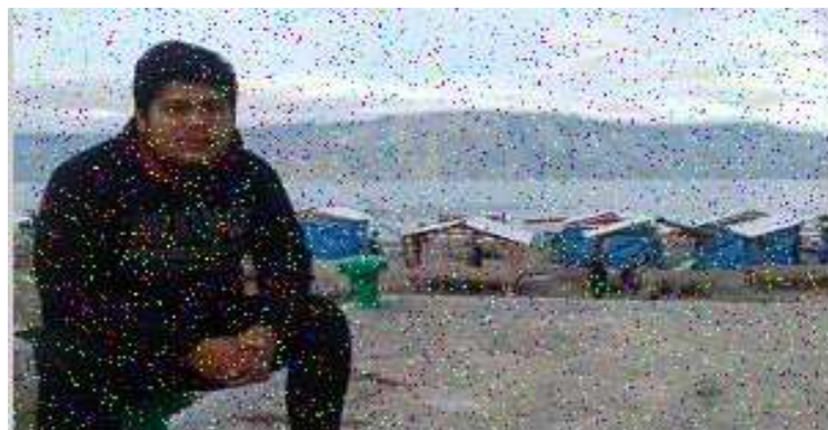
Gambar 1. Citra Ber-Noise

Noise pada citra akan dihilangkan dengan New Adaptive Based Median Filter menggunakan aturan kedua deteksi noise, dengan cara proses pertama dilakukan adalah membandingkan nilai piksel 1 dan nilai piksel 2 untuk setiap elemen matriks yang tersedia, jika nilai yang dibandingkan = 1 atau > 0 maka proses median dilakukan jika tidak lakukan perbandingan ulang untuk elemen baru. (n-1) piksel yang diproses dikurangi satu persatu hingga semua diproses, mulai dari sebelah kiri dulu baru ke kanan.