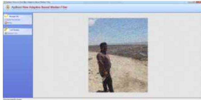
Gambar 7. Noise Pada Seluruh Citra

Gambar 7 menampilkan noise pada seluruh citra, untuk memperbaiki noise masih dilakukan dengan cara yang sama dan didapat hasil sebagai berikut: