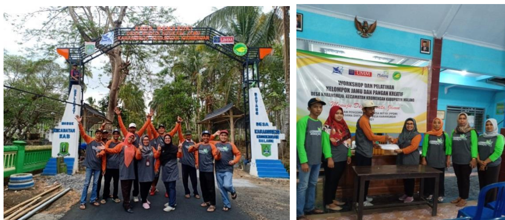
Gambar 8: finishing gapura ditandai dengan serah terima kepada kepala desa

Proses perancangan dan pengerjaan pintu gerbang selamat datang ini memerlukan waktu yang cukup lama. Perlu pengukuran yang jelas tentang ketinggian lengkung gapura mengingat juga terdapat kendaraan besar yang melintasi pintu masuk tersebut. Disamping kiri kanan bagian dalam gapura ditambahkan taman kecil guna mempercantik sambutan bagi para pengunjung desa wisata. Proses pembangunan ini masih terus berlangsung dikarenakan untuk mengupayakan taman masih menunggu adanya turun hujan.