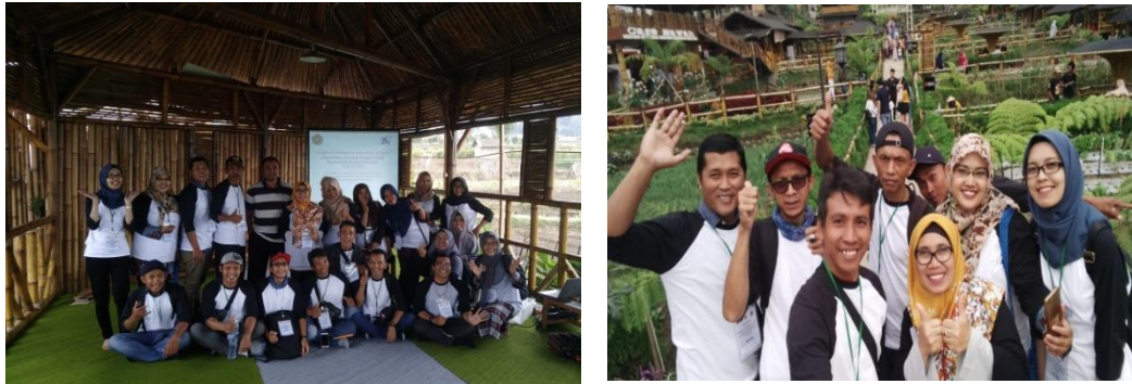
Gambar 3: Studi banding ke Pujon Kidul sebagai desa wisata

Hasil studi banding berupa informasi tentang proses pembentukan Bumdes, pengelolaan café sawah, pengembangan café, sampai pada pengelolaan dan pengembangan asset sekitar desa berupa surat keputusan desa.