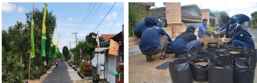
Gambar 6: aktifitas penanaman kembali toga oleh mahasiswa KKN bersama tim pengabdian UMM

Sebagai symbol desa jamu, maka desa Karangrejo harus menghidupkan kembali penanaman toga di pekarangan rumah masing-masing warga. Kegiatan ini didukung oleh keputusan kepala desa untuk menggiatkan kembali penanaman toga dengan diberikan bantuan berupa polybag dan bibit kunyit, kencur, jahe dan toga lainnya.