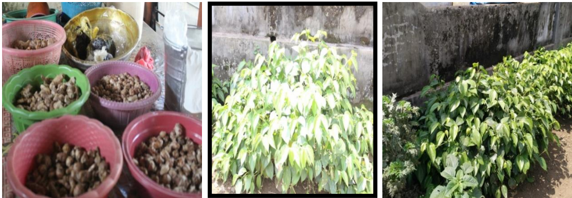
Gambar 1: bahan obat yang mudah diperoleh di pekarangan desa Karangrejo

Hasil jamu ini sangat istimewa karena hasil produksinya yang nikmat, lebih tahan lama meskipun tanpa pengawet, namun untuk mendapatkan hasil produk jamu yang memuaskan ini memerlukan waktu, dan tenaga yang banyak. Proses produksi yang masih menggunakan peralatan tradisional menyebabkan hasil produksi terbatas omsetnya. Belum lagi persoalan pemasaran, juga menjadi kendala yang besar. Dalam proses pemasaran, masih terbatas dilakukan di daerah sekitar Desa hingga sekitar Kabupaten Malang. Meskipun terdapat kurang lebih 150 keluarga yang memproduksi jamu, namun penjualan masih dilakukan secara sporadis, secara terpisah-pisah dan tidak terkoordinir. Setiap pagi hari Ibu-ibu penjual jamu menjajakan jamunya dengan cara diangkut bersama dan didrop di titik-titik tertentu di luar desa Karangrejo maupun di luar kabupaten Malang seperti Malang, Blitar, Trenggalek dan baru pulang pada sore atau malam hari.