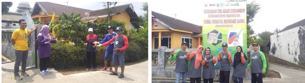
Gambar 10: area titik nol yang akan dibangun monumen wisata jamu

Saat ini sudah dilakukan sosialisasi tentang penetapan lokasi wisata berdasarkan Perdes no 6/2019, dan sudah terpasang Baliho sebagai penanda akan dibangunnya area wisata tersebut. Pembangunan masih memerlukan dana yang besar dan desa Karangrejo sudah menyiapkan anggaran tersebut untuk tahun ke dua.