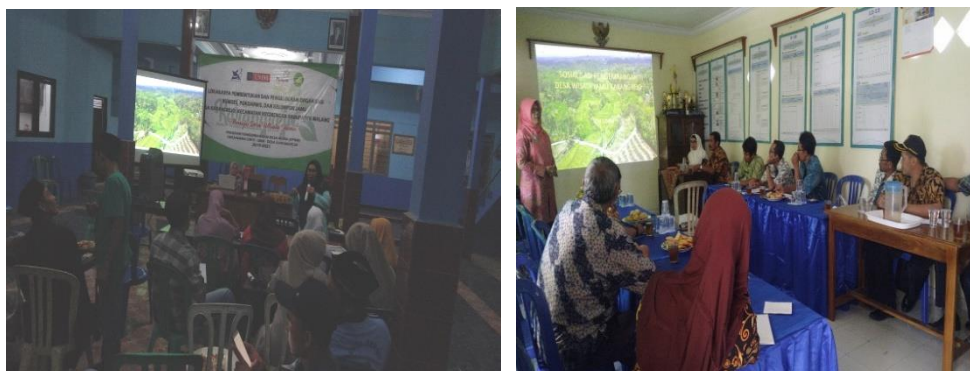
Gambar 11: Proses Pendampingan Dan Pembinaan BUMDes, POKDARWIS dan POKJAMU

POKJAMU Karangrejo. Saat ini sedang berlangsung proses pengerjaan Standard Operasional Prosedur (SOP) baik dalam organisasi BUMDes, maupun POKDARWIS. Penyusunan SOP mengacu pada visi, misi organisasi dan visimisi desa, agar terjadi sinergi dan