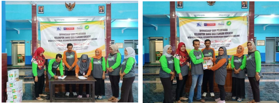
Gambar 13 proses serah terima alat blender kepada BUMDes untuk membantu mempercepat produksi dan menjaga higienitas jamu

Proses produksi yang sangat menyita waktu serta tidak higienis juga disebabkan karena rata-rata pengrajin masih menggunakan alat tradisional berupa lumpang dan alu, sehingga dalam pendampingan ini, tim Pengabdian UMM juga menyerahkan bantuan 10 Blender kepada BUMDes sekaligus sebagai modal usaha BUMDes untuk disalurkan kepada pengrajin dengan sistem pembelian yang mudah dan murah.