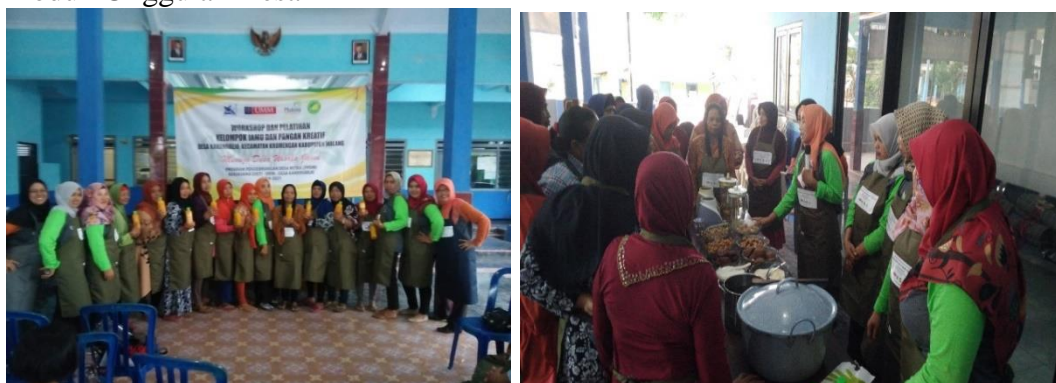
Gambar 12: pelatihan dan pendampingan produksi jamu yang higienis dan aman

Aktifitas pembuatan jamu yang sebenarnya sudah turun temurun dilakukan oleh kurang lebih 150 pengrajin sekaligus penjual jamu, namun proses pengolahan yang dilakukan belum menjamin kualitas produksi dan higienitas. Saat ini setiap hari, produksi pedagang bisa mencapai 8 – 13 botol ukuran 1,5 liter, dan mendapatkan penghasilan kotor kurang lebih 150 ribu dari pagi hingga malam hari. Namun proses pembuatan yang lama, memungkinkan produktifitas dan kinerja pedagang sangat tidak proporsional dengan penghasilan yang diperoleh. Proses pengemasan yang masih menggunakan daur ulang serta pemasaran terbatas hanya bertahan selama 3-5 hari. Oleh karenanya pendampingan yang dilakukan oleh Tim Pengabdian UMM lebih awal menitik beratkan pada proses produksi yang higienis dan pemahaman tentang pengemasan yang aman dan bukan daur ulang. Kegiatan ini dimaksudkan untuk memberdayakan dan meningkatkan produktifitas “bakul Jamu” sehingga meningkat pula kesejahteraan warga dan produk jamu sebagai Produk Unggulan Desa