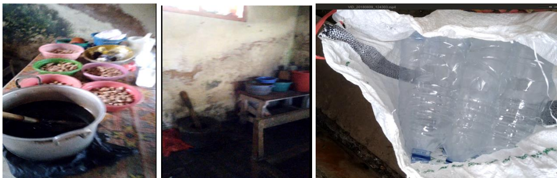
Gambar 2: Proses pengolahan jamu yang masih konvensional dengan kemasan daur ulang

Hasil jamu ini sangat istimewa karena hasil produksinya yang nikmat, lebih tahan lama meskipun tanpa pengawet, namun untuk mendapatkan hasil produk jamu yang memuaskan ini memerlukan waktu, dan tenaga yang banyak. Proses produksi yang masih menggunakan peralatan tradisional menyebabkan hasil produksi terbatas omsetnya. Belum lagi persoalan pemasaran, juga menjadi kendala yang besar. Dalam proses pemasaran, masih terbatas dilakukan di daerah sekitar Desa hingga sekitar Kabupaten Malang. Meskipun terdapat kurang lebih 150 keluarga yang memproduksi jamu, namun penjualan masih dilakukan secara sporadis, secara terpisah-pisah dan tidak terkoordinir. Setiap pagi hari Ibu-ibu penjual jamu menjajakan jamunya dengan cara diangkut bersama dan didrop di titik-titik tertentu di luar desa Karangrejo maupun di luar kabupaten Malang seperti Malang, Blitar, Trenggalek dan baru pulang pada sore atau malam hari.