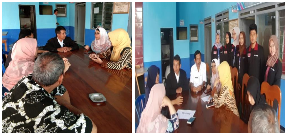
Gambar 4: proses diskusi yang menghasilkan kesepakatan kegiatan Pendampingan dan Pembinaan BUMDes, POKDARWIS dan POKJAMU

Hasil pertemuan disepakati bahwa ditahun pertama, akan dilakukan pemenuhan sarana penunjang untuk terbentuknya desa wisata berupa gerbang selamat datang, dan monument titik nol desa wisata. Selain itu ditetapkan untuk memberikan pembinaan berupa pelatihan bagi bakul jamu melalui pembentukan kelompok kecil yang didasarkan pada hasil pemetaan bersama ketua PKK dan tim pengabdian UMM. Dari hasil pemetaan ditetapkan 13 kelompok kecil yang merupakan perwakilan dari RT/RW setempat yang diharapkan menjadi inspiator bagi bakul jamu lainnya yang belum teridentifikasi.