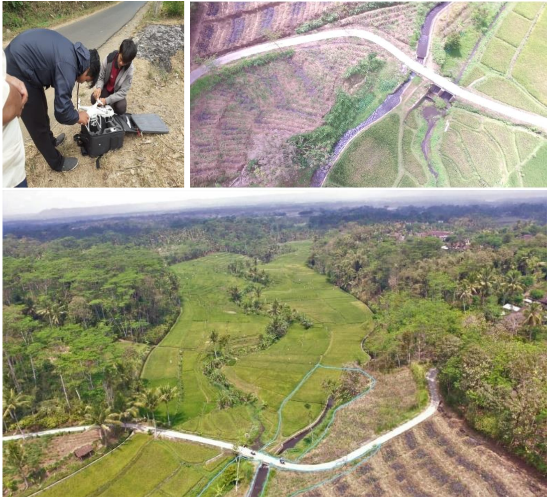
Gambar 5: titik nol desa wisata di dusun blado karangrejo

Penetapan titik wisata terletak di dusun Blado, pada tanah bengkok pemerintahan desa Karangrejo, proses penetapan memerlukan pemotretan dengan menggunakan Drone sehingga diperoleh batasan yang jelas atas wilayah wisata.