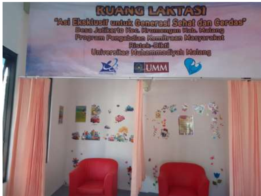
Gambar 2. Ruang Laktasi Desa Jatikerto

Ruang laktasi berada satu tempat dengan Polindes. Gambaran ruang laktasi desa Jatikerto dapat dilihat pada gambar berikut :