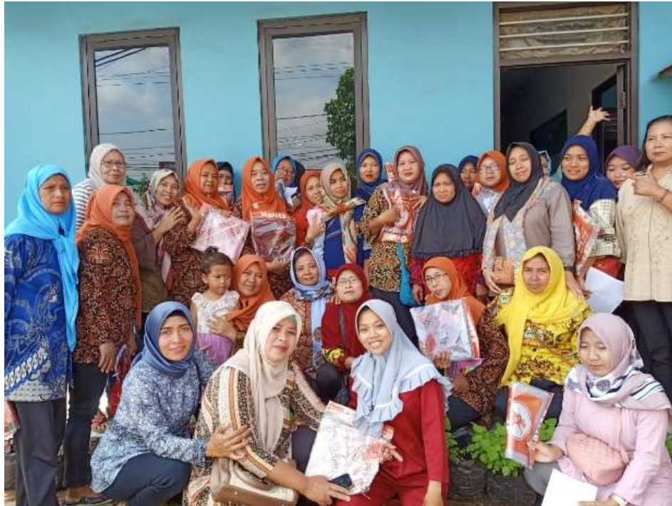
Gambar 4. Dokumen Kegiatan Evaluasi melalui pengisian kuesioner oleh kader

Berikut adalah indikator yang menunjukkan dampak dan manfaat dari kegiatan pengabdian yang telah dilaksanakan :