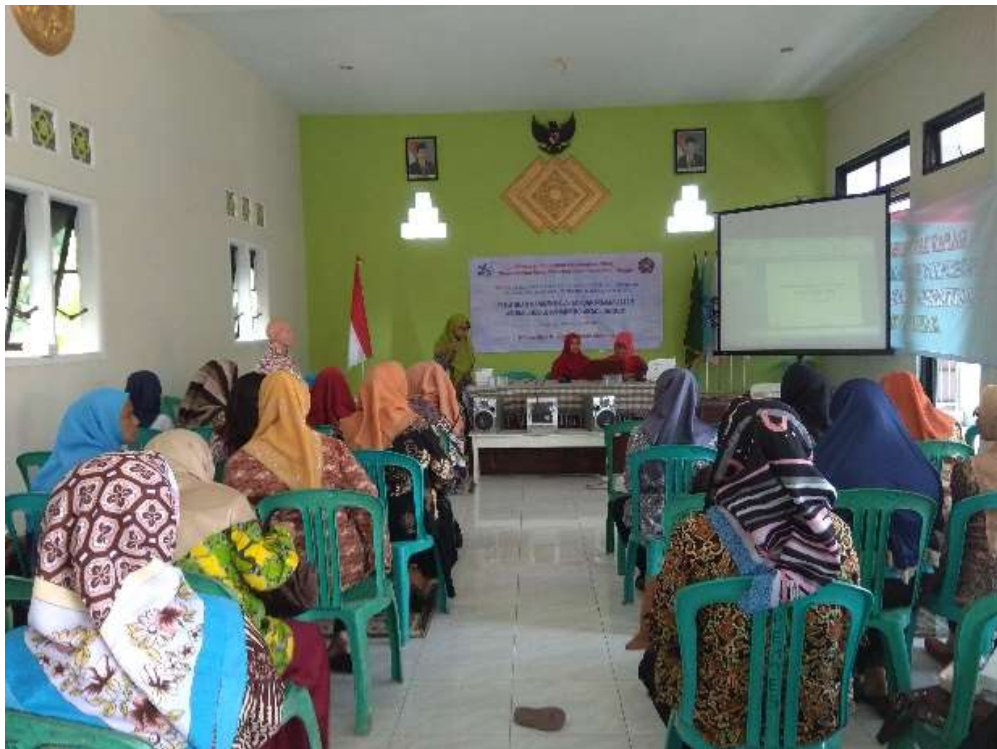
Gambar 3. Dokumen Kegiatan Pelatihan

Berdasarkan hasil evaluasi yang telah dilakukan melalui metode wawancara selaca langsung dan melalui penyebaran kuesioner. Didapatkan kesimpulan sebagai berikut :