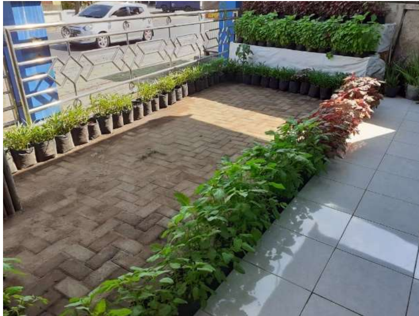
Gambar 5. Halaman polindes