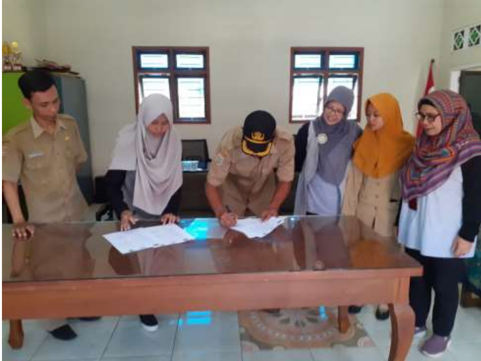
Gambar 1. Penandatanganan Surat Penyerahan kepada Kepala Desa Jatikerto