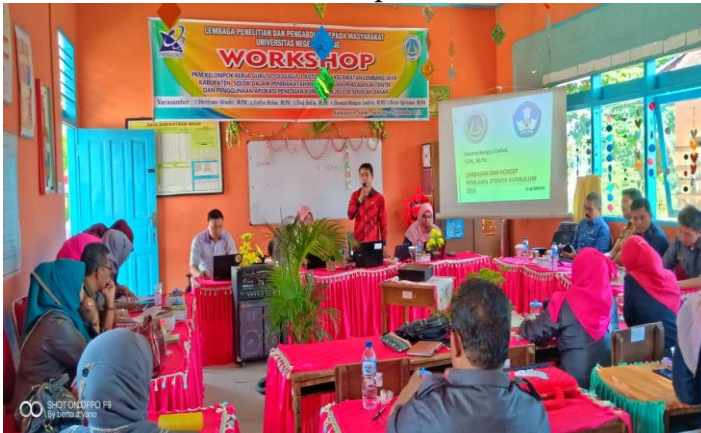
Gambar 2. Pemateri Menyampaikan Pengetahuan Penilaian Sikap, Pengetahuan dan Keterampilan

Selanjutnya, pemateri menyampaikan bahwa penilaian pengetahuan. Bertujuan untuk mengukur kemampuan siswa dari segi faktual, konseptual, dan prosedural. Penilaian pengetahuan bertujuan untuk mengukur penguasaan kompetensi siswa. Teknik penilaian pengetahuan dapat berupa tes tulis, lisan dan penugasan.