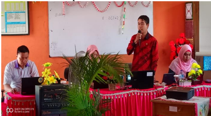
Gambar 1. Pemateri Menampaikan Hakikat Penilaian Otentik

Pemateri menyampaikan bahwa guru harus melakukan penilaian dalam ketiga aspek tanpa harus mengunggulkan salah satu penilaian. Adapun penilaian tersebut terdiri dari penilaian sikap, kognitif, dan keterampilan.