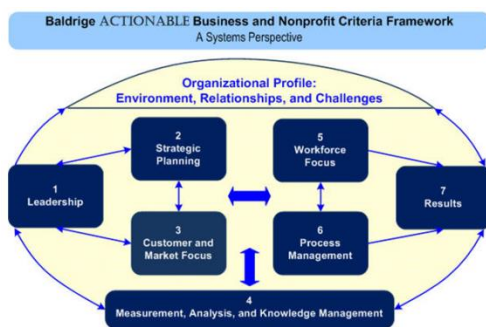
Gambar 1. Kerangka Kategori MBCfPE

Berikut merupakan gambar kerangka kategori MBCfPE yang dapat dilihat pada Gambar 1.