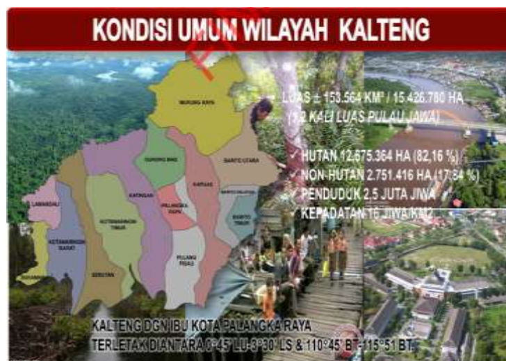
Gambar 1. Kalimantan Tengah

Lingkungan yang baik merupakan hak setiap orang. Pengelolaan dan perlindungan lingkungan merupakan tanggung jawab bagi setiap individu maupun kelompok. Andil pemerintah sangat penting dalam kegiatan pengelolaan dan perlindungan lingkungan hidup. Sehingga apa yang diinginkan dapat terwujud dengan baik. " setiap orang berhak hidup sejahtera lahir dan batin, bertempat tinggal, dan mendapatkan lingkungan hidup yang baik, dan sehat serta berhak memperoleh layanan kesehatan" amanat pasal 28H ayat 1 Undang-Undang dasar Negara Republik Indonesia Tahun 1945. Sebagai salah satu dasar berprilaku bijak terhadap lingkungan, kalau ingin hidup aman, nyaman, dan tentram. Misalnya penerapan pengelolaan lingkungan di Provinsi Kalimantan Tengah.