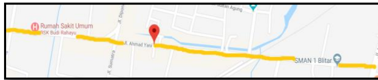
Gambar 1. Denah Lokasi

Waktu : Jum'at, 1 Juni 2018 (kurun waktu dalam 1 minggu jam aktif pagi, dan sore. Jam senggang siang, dan malam)