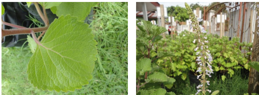
Gambar 1. Daun dan bunga tanaman bangun-bangun