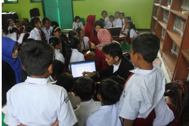
Gambar 1.2 Proses Pengenalan TIK

Target dari pengenalan TIK yaitu siswa-siswi kelas IV sampai dengan kelas VI di SDN 1 Tahunan sebanyak 51 anak. Pelatihan ini dilakukan setiap hari jam 10.00 – 12.00 dari tanggal 7 Agustus 2018 sampai dengan 27 Agustus 2018 yang hasil akhirnya diharapkan siswa-siswi SDN 1 Tahunan dapat mengoperasikan MS.Word dengan baik dan mengerti fungsi dari panel-panelnya.