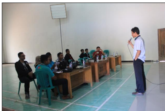
Gambar 1.3 Pelatihan Smart E-Commerce

Program kerja bidang pendidikan selanjutnya yaitu memberikan pelatihan smart smart e-commerce pada tanggal 15 Agustus 2018 pada jam 14.00 – selesai. Yang menjadi sasaran pelatihan ini yaitu anggota BUMDes Tahunan mulai dari pembuatan akun hingga pemasaran produk di Tokopedia, BukaLapak, Shopee dll. Pelatihan ini diberikan supaya BUMDes Tahunan dapat membantu memasarkan produk-produk olahan DesaTahunan dan dapat memanfaatkan teknologi dengan baik.