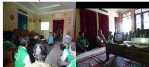
Gambar 3. Sosialisasi potensi metabolit sekunder untuk mengendalikan penyakit jagung

Hasil sosialisasi menunjukkan terjadi peningkatan pengetahuan peserta sebesar 52,17 – 76,23 %.