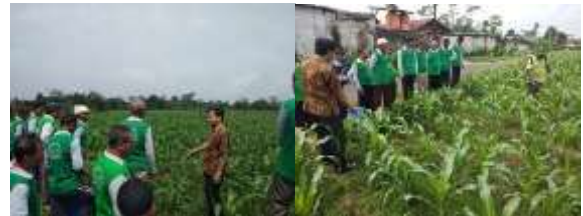
Gambar 6. Pendampingan petani di lapangan

kegiatan di lapangan, tim mendampingi secara langsung, pembuatan metabolit sekunder ramah lingkungan dari mulai pemilihan bahan yang murah dan mudah dijumpai di sekitar petani, alat yang mudah dijumpai dan tersedia serta kiat dan kendala dalam proses pembuatannya. Kemudian pendampingan diteruskan sampai kepada cara aplikasi metabolit sekunder pada budidaya tanaman jagung. Dari mulai cara perendaman benih jagung yang akan ditanam sampai cara aplikasi metabolit sekunder di lapangan. Demikian juga alat yang digunakan, konsentrasi serta saat aplikasi yang disesuaikan dengan fenologi tanaman. Cara penyimpanan dan lama simpan yang disarankan juga diinformasikan ke petani mitra.