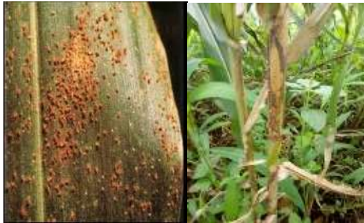
Gambar 2. Gejala penyakit karat daun dan hawar pelepah pada tanaman jagung.

3. Upaya pengendalian penyakit yang dilakukan selama ini lebih menekankan kepada penggunaan fungisida kimia sintetik. Namun demikian, hasilnya kurang memuaskan. Disamping itu, konsekuensi dampak negatif yang diakibatkannya cukup besar. Pemanfaatan metabolit sekunder sebagai bio pestisida yang efektif dan ramah lingkungan belum diadopsi petani. Bertitik tolak dari uraian di atas maka dilakukan sosialisasi perbaikan dalam budidaya tanaman jagung dengan memanfaatkan metabolit sekunder Trichoderma sp. dan P. fluorescens untuk mengendalikan Penyakit Utama serta Meningkatkan Hasil Tanaman Jagung di Desa Tambaksogra Kecamatan Sumbang Kabupaten Banyumas.