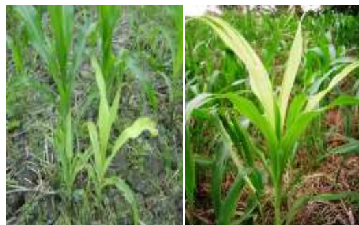
Gambar 1. Gejala penyakit bulai pada tanaman jagung

merupakan penghambat utama produksi jagung dari kelompok tani tersebut (Gambar 1). Selama ini penyakit bulai selalu menjadi masalah utama dalam budidaya jagung. Apabila jamur ini menginfeksi tanaman muda dari varietas rentan dapat mengakibatkan kerusakan tanaman sampai 100%. Penyebaran penyakit bulai terjadi sangat cepat, karena konidia menyebar melalui udara dan oosporanya dapat tersimpan lama di tanah serta dapat menular melalui benih, terutama pada benih yang masih segar dan berkadar air tinggi. Pada Kelompok Tani Mugi Rahayu kehilangan hasil akibat penyakit ini rata-rata mencapai 30-40 %. Namun pada musim hujan, beberapa petani mengalami penurunan produksi sampai 60 %.