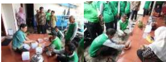
Gambar 4. Pelatihan pembuatan metabolit sekunder

Pembuatan metabolit sekunder dilakukan dengan menggunakan bahan yang ada di sekitar petani yaitu: air kelapa, air cucian beras dan kaldu keong mas. Dalam pelatihan ini petani peserta dibatkan secara langsung dalam kegiatan dengan harapan setelah pelatihan petani peserta secara mandiri mampu menerapkan hasil pelatihannya. Hasil evaluasi menunjukkan bahwa terjadi peningkatan ketrampilan petani peserta tentang pembuatan metabolit sekunder sebesar 88,12-92,13 persen.