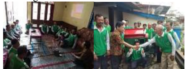
Gambar 7. Diseminasi hasil kegiatan dan penyerahan bantuan alat kepada petani mitra

Setelah kegiatan demplot dilaksanakan selanjutnya kegiatan berikutnya adalah evaluasi akhir dan diseminasi kegiatan. Evaluasi dilakukan berdasarkan analisis dan interpretasi data pengamatan di lapangan, evaluasi dilakukan bersama antara Tim Pengabdian dan anggota kelompok tani. Berdasarkan hasil evaluasi menunjukkan bahwa penggunaan metabolit sekunder kedua mikroba antagonis dapat mengatasi masalah yang dihadapi petani. Hal ini semakin membuka wawasan petani akan manfaat teknologi metabolit sekunder.