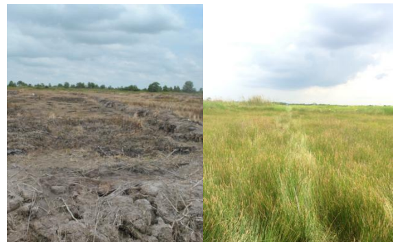
Gambar 3. Tutupan Lahan Semak Rumput

Jenis tutupan lahan berupa lahan terbuka dan semak rumput purun yang tumbuh pada lahan mineral yang telah dibuka untuk pencetakan sawah baru, di mana saat ini belum dilakukan pengolahan dan penanaman tanaman padi. Kondisi tutupan lahan disajikan pada Gambar 3.