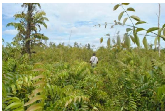
Gambar 5. Tutupan Lahan Semak Pakis

Jenis tutupan lahan berupa semak tumbuhan pakis bercampur dengan pohon gelam yang merupakan tanaman pionir di lahan bekas kebakaran. Hal ini diperkuat juga dengan permukaan tanah yang masih terdapat arang hitam. Kondisi tutupan lahan disajikan pada Gambar 5.