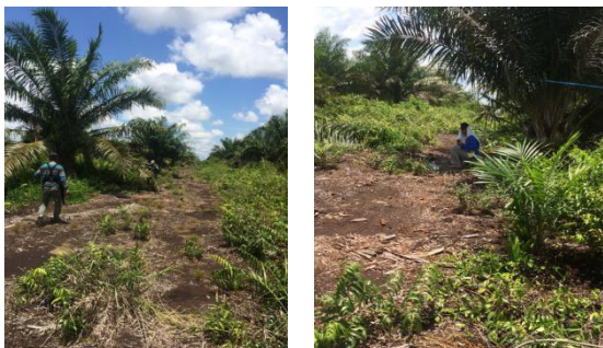
Gambar 1. Tutupan Lahan Kebun Sawit

Jenis tutupan lahan berupa perkebunan sawit plasma dengan tanaman sawit berumur 3-4 tahun. Kondisi tutupan lahan di lokasi ini disajikan pada Gambar 1.