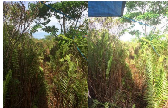
Gambar 2. Tutupan Lahan Semak Pakis

Jenis tutupan lahan berupa semak alang-alang campur tanaman pakis/kelakay dan pohon gelam yang merupakan tanaman pionir di lahan bekas kebakaran. Hal ini diperkuat juga dengan permukaan tanah yang masih terdapat arang hitam. Kondisi tutupan lahan disajikan pada Gambar 2.