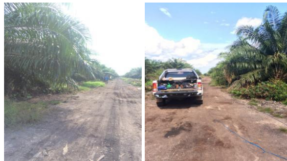
Gambar 6. Tutupan Lahan Kebun Sawit

kebun sawit di titik sampling disajikan pada Gambar 6.