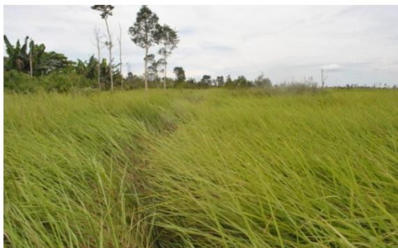
Gambar 4. Tutupan Lahan Semak Alang-Alang dan Pohon Gelam

Jenis tutupan lahan berupa semak alang-alang campur tanaman dan pohon gelam yang merupakan tanaman pionir di lahan bekas kebakaran. Hal ini diperkuat juga dengan permukaan tanah yang masih terdapat arang hitam. Kondisi tutupan lahan disajikan pada Gambar 4.