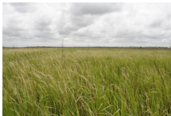
Gambar 7. Tutupan Lahan Kebun Sawit

Jenis tutupan lahan di titik ini adalah berupa semak tanaman pakis yang merupakan tanaman pionir di lahan bekas kebakaran. Hal ini diperkuat juga dengan permukaan tanah yang masih terdapat arang hitam. Kondisi tutupan lahan disajikan pada Gambar 7.