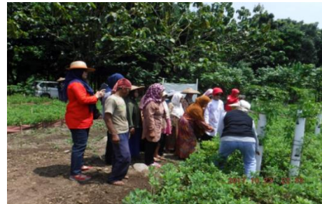
Gambar 4. Demo dan Pelatihan Pertanian Verticultur Pada Rorak yang disiapkan dengan Tanaman Pangan.