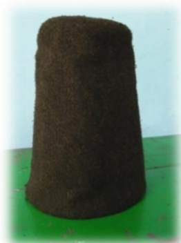
Gambar 2. Topi Sikke