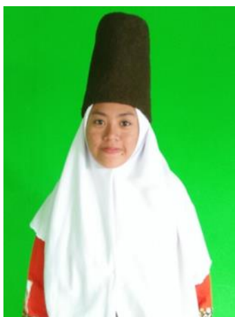
Gambar 1. Tata rias: Polos

Tata rias pada tari sufi yaitu tidak menggunakan tata rias, maksudnya para penari tidak merias wajahnya. Karena semua mencerminkan fitroh (kesucian), tidak menonjolkan riasan wajah. Tetapi menonjolkan busana yang dipakai sebagai kostum sekaligus properti menari.