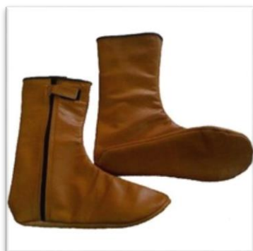
Gambar 4. Quff (Kaos kaki)