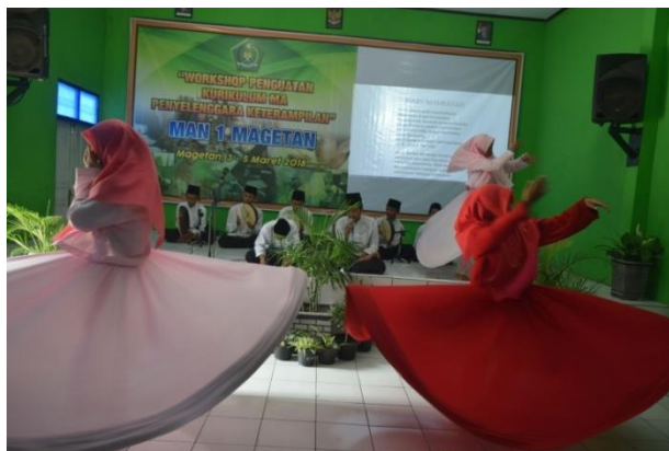
Gambar 6. Hadrah habsyi, musik pengiring tari Sufi MAN 1 Magetan

Pola Lantai pertunjukkan tari sufi MAN 1 Magetan tidak memiliki pola tertentu tetapi menyesuaikan tempat pertunjukan dan jumlah penari. Sedangkan tempat pertunjukan yang digunakan tari sufi ini pada dasarnya membutuhkan arena yang luas agar memudahkan penari dalam berputar, sehingga rok/tennur bisa berkembang meliuk-liuk dengan indah. Tempat pertunjukan tari sufi dapat ditampilkan di tempat terbuka ataupun tertutup. Tari Sufi Man 1 Magetan biasa tampil dimana saja, di panggung, halaman masjid, halaman rumah, lapangan, gedung pertemuan, bahkan pernah juga di jalan raya. Pada waktu itu mengikuti pawai Tujuh Belas Agustus dan tampil di sepanjang jalan, dan salah satu penari menari diatas mobil terbuka yang sudah disiapkan meja untuk menari. Hebatnya, penarinya tidak jatuh.