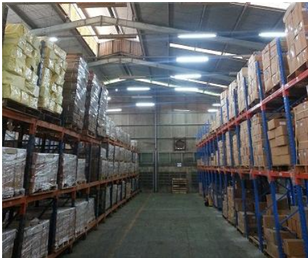
Gambar 4. Kondisi gudang sesudah perbaikan