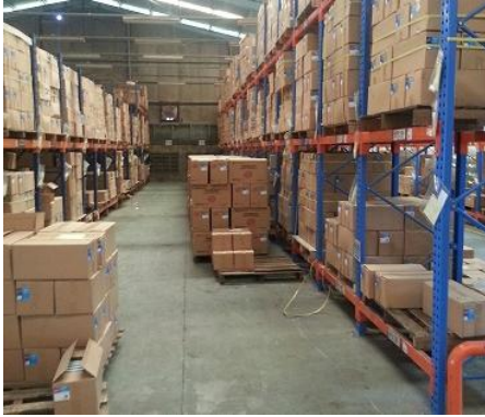
Gambar 3. Kondisi gudang sebelum perbaikan