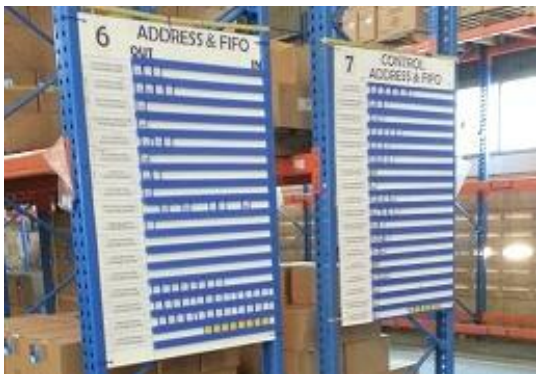
Gambar 5. Papan FIFO dan addressing Perbaikan Standar Gudang

Papan FIFO sekaligus addressing dapat membantu operator pekerja untuk mencari barang dan mengetahui barang mana yang harus keluar terlebih dahulu. Papan ini diletakkan pada masing-masing rak sehingga pada satu papan dapat memuat tipe-tipe barang yang ada pada satu rak. Setiap rak pada produk barang jadi memiliki fixed location storage untuk mempermudah pengontrolan serta dapat mendukung berjalannya sistem FIFO. Papan FIFO dan addressing yang sudah berjalan dengan baik dan efektif terdapat pada rak di area finish good . Koin yang digunakan pada papan FIFO dan addressing dapat menjelaskan alamat barang serta jumlah barang yang ada pada slot rak tersebut.