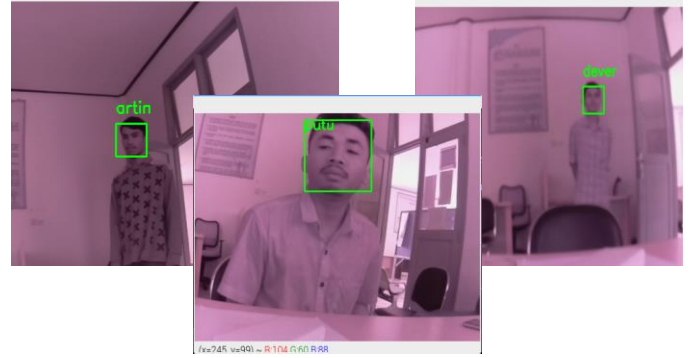
Gambar 2 Verifikasi Tiga Peserta Ujian melalui Face-Recognition

Hasil dari implementasi berdasarkan skenario pada gambar 1 dapat mengenal peserta ujian yang terlihat pada gambar 2.