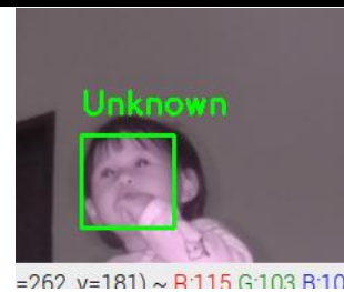
Gambar 4 Contoh Hasil Id Peserta Tidak Ditemukan

System Pengenalan Wajah Peserta Tes Online Video Size (x,y)= 640 x 480 Unknown