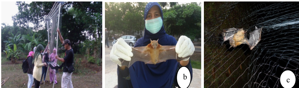
Gambar 1. (a) Pemasangan harp net, (b) Kelelawar yang tertangkap pada mist net, (c) kelelawar yang tertangkap dan diidentifikasi

Data antropogenik (persepsi masyarakat) terhadap kelelawar diperoleh dengan metode wawancara terhadap 120 orang responden yang dipilih berdasarkan cluster, masing masing 40 responden di setiap kecamatan. Dari 40 responden dipilih secara acak 20 orang pria dan 20 orang wanita berusia 15 s.d 60 tahun. Persepsi masyarakat terhadap kelelawar digali melalui 20 pertanyaan terkait persepsi negatif dan positif. Analisis terhadap persepsi dan perilaku masyarakat menggunakan metode triangulasi dengan kriteria penilaian sebagai berikut: