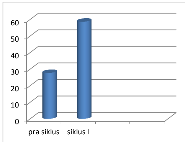
Gambar 1 Grafik Perbandingan Hasil Belajar Siswa Pra siklus & Siklus I

Grafik perbandingan hasil belajar siswa diatas menunjukkan bahwa penerapan pembelajaran passing bawah melalui melempar bola memberikan banyak manfaat kepada siswa kelas IV SD Negeri 85/II Apung Mudik .Dilihat dari grafik tersebut adanya peningkatan pada pra siklus ke siklus siklus I.