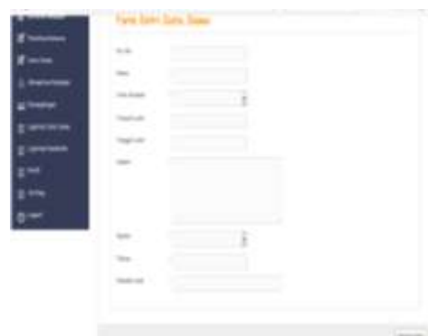
Gambar3. FormInput Data Siswa

Form input data siswa berfungsi untuk menginputkan data siswa yang sudah dirancang. Adapun bentuk form input data siswa dapat dilihat pada Gambar 3.