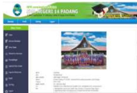
Gambar 2. Halaman Menu Utama Admin