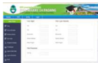
Gambar. 4. FormInput Alternatif Penilaian

Form input alternative penilaian berfungsi untuk menginputkan nilai rapor, nilai un dan tes iq yang telah dirancang. Adapun bentuk form alternative penilaian dapat dilihat pada Gambar 4.