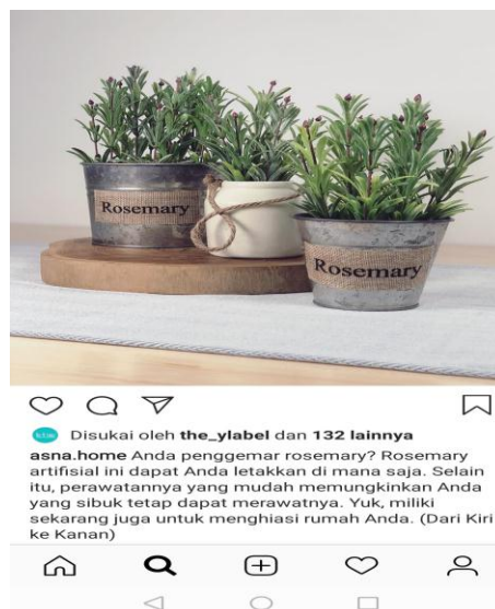
Gambar 2. Produk Asna Home dengan Tambahan Caption

Pada Gambar 1 ini, Asna Home memasarkan produknya tanpa menyisipkan caption yang unik dengan bahasa bersifat persuasif. Gambar ini diterbitkan tanggal 19 Maret 2018 yang merupakan gambar pertama di akun Instagram Asna Home Decor. Dapat dilihat pada gambar ini hanya ada dua puluh satu orang yang menyukai gambar ini. Teks di gambar ini dibuat sangat sederhana hanya berupaya menyampaikan produk yang dijual. Bisa dibandingkan dengan gambar berikut ini saat ditambahkan caption pada gambar produk Asna Home Decor.