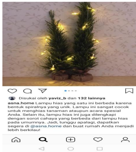
Gambar 3. Produk Asna Home Dengan Caption .

Apabila kita analisis paragraf di atas tidak ada satu kalimat yang berbicara tentang Hari Natal. Akan tetapi, redaksi bahasa yang dibuat tetap bersifat persuasif dengan beberapa kata kunci seperti ‘acara spesial’. Hal ini bertujuan untuk menarik minat pembeli yang membutuhkan dekorasi untuk merayakan Natal. Di media sosial seperti Instagram, penggunaan bahasa yang tepat sangat berpengaruh terhadap minat pembeli. Telah disampaikan dalam pembahasan sebelumnya, bahwa terjadi peningkatan penjualan dengan menggunakan sistem daring yang disampaikan dengan redaksi yang menarik.