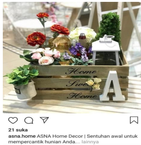
Gambar 1. Instagram Sebelum Menggunakan Caption.

Pada Gambar 1 ini, Asna Home memasarkan produknya tanpa menyisipkan caption yang unik dengan bahasa bersifat persuasif. Gambar ini diterbitkan tanggal 19 Maret 2018 yang merupakan gambar pertama di akun Instagram Asna Home Decor. Dapat dilihat pada gambar ini hanya ada dua puluh satu orang yang menyukai gambar ini. Teks di gambar ini dibuat sangat sederhana hanya berupaya menyampaikan produk yang dijual. Bisa dibandingkan dengan gambar berikut ini saat ditambahkan caption pada gambar produk Asna Home Decor.