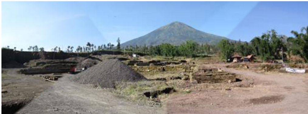
Gambar 1. Kondisi Situs Liyangan saat dilakukan penelitian pada tahun 2015

Situs Liyangan berada di lereng timur laut Gunungapi Sindoro, tepatnya di Dusun Liyangan, Desa Purbasari, Kecamatan Ngadirejo, Kabupaten Temanggung, Jawa Tengah. Secara astronomis situs ini berada pada koordinat 7^{\circ} 15' 6,7766'' LS - 110^{\circ} 01' 37,2203'' BT dan pada ketinggian antara 1.100 - 1.200 meter dari permukaan air laut. Situs permukiman bercorak Hinduistik ini ditemukan terkubur di bawah lapisan endapan aliran piroklastik atau awan panas setebal 4 - 7 meter. Situs Liyangan menjadi kapsul waktu yang dapat memberikan informasi cukup lengkap tentang permukiman Jawa Kuno. Temuan arkeologi seperti itu sangat jarang terjadi. Hingga penelitian ini dilakukan area situs yang sudah terungkap sekitar 200 m x 300 m atau 6 hektar dan sejumlah temuan baru masih terus dilaporkan. Diyakini, saat ini area Situs Liyangan yang terkupas sudah jauh lebih luas karena aktivitas pertambangan yang terus berlangsung meskipun telah dilarang.