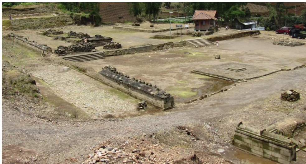
Gambar 3. Temuan sejumlah struktur batu di teras ketiga dan keempat

Di teras kedua, terdapat satu struktur batur dengan kaki tinggi (sekitar 1,5 m). Struktur ini sering disebut sebagai bangunan Candi I dalam laporan penelitian Balai Arkeologi Yogyakarta. Susunan batu-batu pada struktur ini masih sangat solid , sehingga diyakini masih dalam kondisi asli termasuk jejak atau sisa dinding pada ambang pintu yang dapat dikenali.