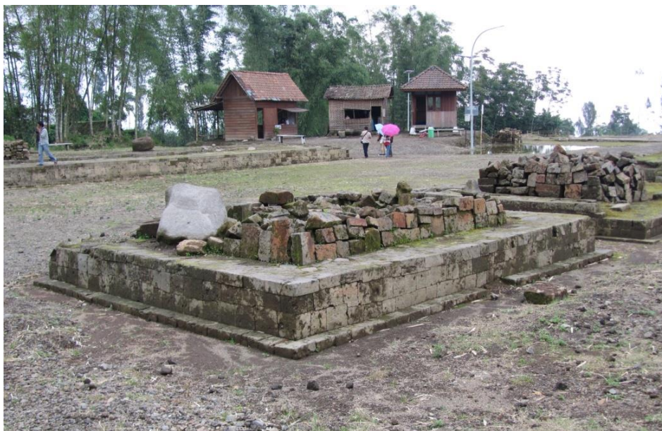
Gambar 4. Salah satu struktur batur batu di teras keempat Situs Liyangan

Di teras kelima, yang ditalud dengan batu-batu bulat, tidak terdapat bangunan. Bagian ini hanya berupa halaman teras sempit sekitar 3 meter. Teras ke enam ditalud dengan batu-batu bulat. Sebagian halaman teras ini telah dikikis oleh aliran Sungai Langit sehingga mengesankan teras ini terpisahkan dari teras kelima. Dengan kata lain, teras keenam berada di seberang Sungai Langit. Karena kondisi tersebut, keadaan pada halaman teras ini masih sulit untuk