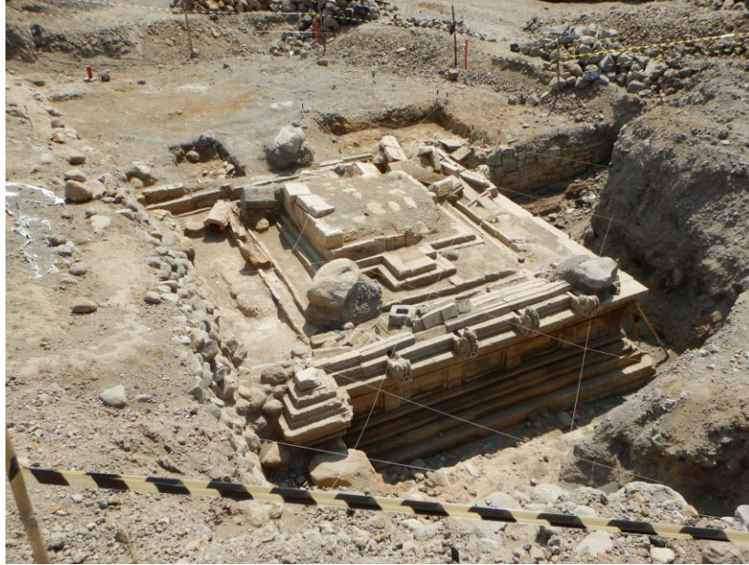
Gambar 2. Bangunan Petirtaan di Teras Pertama Situs Liyangan

tanah situs pada umumnya dan berada di sisi barat laut jalan batu. Terdapat setidaknya tiga atau empat talud untuk memperkuat dinding tebing di atas petirtaan. Hasil ekskavasi di halaman atas petirtaan menunjukkan adanya sejumlah fitur yang diduga bekas tiang penyangga bangunan ( postholes ).