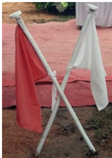
Gambar 2. Bendera Merah Putih, Silat Bendera/ Silat Pengantin Bentan Penao

Simbol bendera berwarna merah dan putih memiliki makna untuk mempersatukan dua insan manusia ke dalam bahtera keluarga. Bendera merah dimaknai sebagai darah merah, dalam hal ini darah dari mempelai wanita. Simbol bendera putih