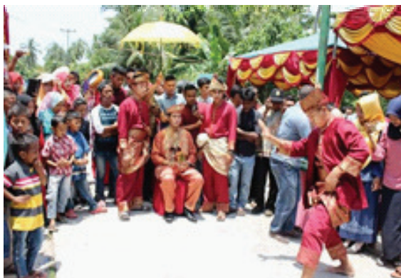
Gambar 3. Sajian Silat Persembahan/Pengantin dalam Upacara Adat Pernikahan Melayu

adalah sajian silat bendera, dan bagian kedua adalah sajian silat persembahan. Bentuk koreografi seni silat Bendera secara sistematis dibedah dengan melihat analisis bentuk gerak, teknik gerak, gaya gerak, jumlah pesilat, analisis jenis kelamin dan postur tubuh, analisis struktur keruangan, struktur waktu, struktur dramatis, analisis tata teknik pentas yang mencakup tata cahaya dan tata rias busana.