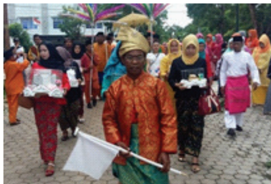
Gambar 1. Pembawa bendera putih pada Prosesi Arak-arakan Pengantin Pria

memiliki peranan dan fungsi yang penting dalam adat Melayu. Perbedaannya, pencak silat umum dengan seni silat Melayu adalah dilihat dari fungsinya. Pencak silat secara umum digunakan untuk menjaga diri/ membela diri, dan sifatnya lebih pada fisik. Sedangkan seni silat Melayu lebih menonjolkan pada langkah bunga seni silat yang memiliki nilai-nilai yang terkandung dalam budaya Melayu. Sifatnya lebih kepada sajian pertunjukan di dalam acara-acara tradisi adat Melayu, di antaranya adalah adat perkawinan. Seni silat Melayu di dalam adat perkawinan wilayah Bentan Penao, dinamakan 'silat bendera'.