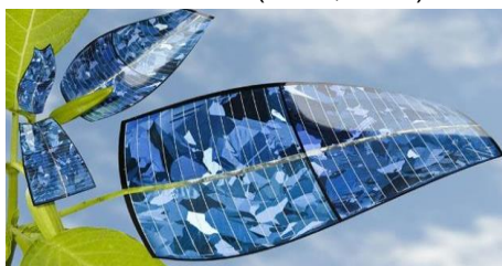
Gambar 11. Daun Bionik