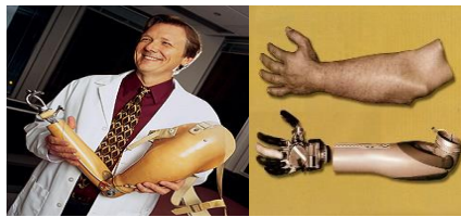
Gambar 2. Tangan Bionik

Salah satu kemajuan dunia robotika yang sangat dinantikan adalah penggabungan komponen robot dengan manusia. Dengan alat ini manusia mampu bergerak atau melakukan aktivitas dengan baik. Bahkan bisa merasakan sesuatu yang telah hilang dari badannya. Teknologi sejenis ini sedang dikembangkan oleh ilmuwan. Ilmuwan mengembangkan sebuah alat yang mampu bergerak sesuai sensor dari saraf dan otot. Saat kita ingin menggerakkan benda ini, maka secara otomatis alat bernama myoelectric meresponsnya. Pada tahun 2006, Todd Kuiken membuat penemuan Bionik dari sebuah kasus kecelakaan, yaitu tangan Bionik. Todd Kuiken menyatakan saraf-saraf di ujung anggota tubuh yang diamputasi tetap dapat mengirim sinyal-sinyal ke otak.