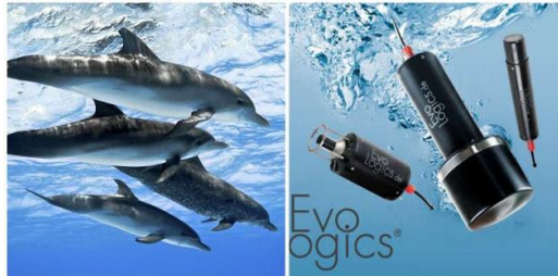
Gambar 9. Bionik Sonar dan Peringatan Tsunami Dari Kebiasaan Lumba-Lumba

Meski teknologi ini memang baru bagi manusia, beberapa hewan sebenarnya sudah menggunakan gelombang suara untuk navigasi, berburu dan mencari mangsa. Kelelawar dan lumba-lumba adalah beberapa di antaranya. Hal yang mereka lakukan adalah memancarkan gelombang suara, lalu mereka menggunakan gema yang muncul untuk mendeteksi lokasi obyek yang berada di sana.