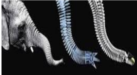
Gambar 7. Tangan Robot Bionik

Robotika selalu terikat oleh keterbatasan komputer, tetapi karena teknologi komputer terus berkembang, perhitungan yang lebih kompleks untuk berbagai gerakan yang lebih luas menjadi mungkin. Kemampuan yang fleksibel, gerakan lembut telah memberikan cara untuk desain yang lebih maju seperti yang satu ini, sistem penanganan 'biomechatronic' baru yang didasarkan pada belalai gajah. Dibuat oleh Festo perusahaan teknik Jerman, robot ini mampu mengangkat beban berat secara halus dengan menggembungkan atau mengempiskan kantung-kantung udara dalam setiap 'tulang belakang'.