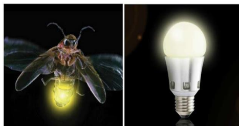
Gambar 10. Bionik Teknologi LED Terinspirasi dari Kunang-Kunang

Melalui penelitian itulah para peneliti menemukan jika lampu di tubuh kunang-kunang memiliki exoskeleton yang bergerigi dengan sisik yang menonjol, serta sebuah permukaan miring di dalamnya. Hal ini yang mencegah refleksi ke dalam dari lampu dan membuat semua cahaya lampu di tubuh kunang-kunang mengarah keluar. Hal ini diaplikasikan oleh seorang ilmuwan bernama Nicolas Andre dari University of Sherbrooke di Kanada, dengan menggunakan laser untuk membuat tekstur serupa dari LED. Hal ini ternyata berhasil dan membuat lampu LED jadi 1,5 kali lebih terang ketimbang sebelumnya, dengan energi yang sama.