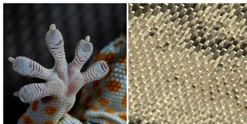
Gambar 8. Perekat Bionik

Sejumlah peneliti dari Universitas Massachusetts, Amherst, telah mengembangkan Geckskin, sebuah perekat dengan kemampuan daya rekat yang kuat. Perekat ini bisa menggantikan jahitan dan staples di rumah sakit. Dengan penemuan ini, ide untuk memiliki kemampuan untuk dapat memanjat di dinding vertikal seperti spiderman mungkin dapat terwujud. Mark Cutkosky, seorang profesor teknik mesin di Universitas Stanford, mengembangkan 'Stickybot' dengan perekat kering jenis yang sama memungkinkan mereka melekat pada permukaan yang paling mustahil. Ini 'perekat arah' bergantung pada jutaan bulu pada punggung kaki tokek. Perekat lain semacam ini seperti berjalan-jalan dengan permen karet pada kaki anda, anda harus menekan ke permukaan dan kemudian anda harus bekerja untuk menariknya keluar. Tapi dengan adhesi terarah, hampir seperti anda dapat semacam kail dan diri anda melepas kaitan dari permukaan (Cutkosky, 2000).