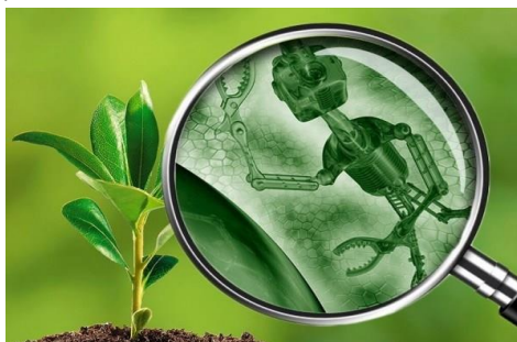
Gambar 12. Daun Bionik

Ide awal proyek tanaman bionik ini berasal dari pemikiran bahwa sel surya mandiri dapat dibuat dari sel tumbuhan. Sel surya mandiri maksudnya sel surya yang dapat memperbaiki dirinya sendiri dan kemampuan memperbaiki diri sendiri hanya dapat dilakukan oleh makhluk hidup (sel hidup) (Juan, et al, 2014).