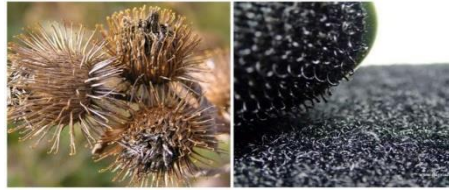
Gambar 13. Velcro Terinspirasi dari Tanaman Burdock