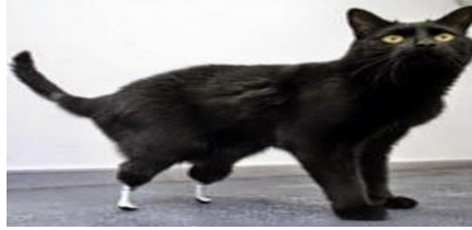
Gambar 6. Kucing Bionik