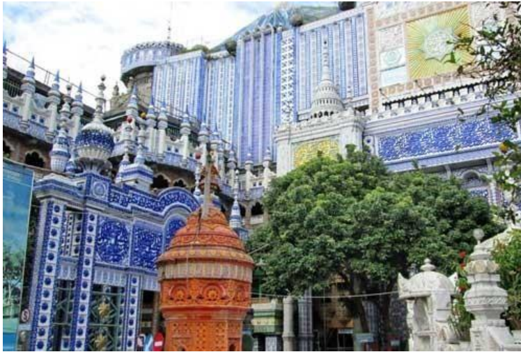
Gambar 3: Nampak bangunan dari sudut depan PP Bihaaru Bahri Asali Fadlaailir Rahmah