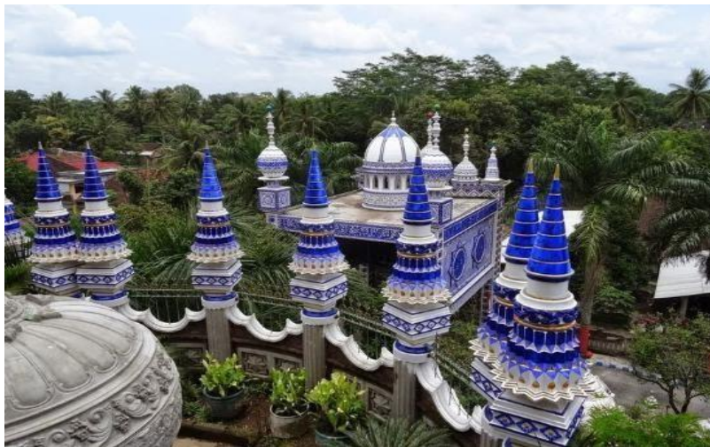
Gambar 1: Nampak bagian atas Ornamen Bangunan PP. Bihār Bahr 'Asal Fadlāil al-Rahmah

Meskipun pondok pesantren yang dikenal sebagai tempat wisata religi ini banyak didatangi pengunjung, tidak ada sedikitpun pungutan pada setiap pengunjung yang memasuki wilayah pondok pesantren. Parkir pun, asalkan di dalam wilayah pondok pesantren, tidak dikenai biaya. Padahal, para tamu pondok pesantren disambut dengan sikap profesional oleh para petugas pondok mulai dari pengisian karcis sebagai bentuk pamit kepada kyai hingga penjagaan parkir kendaraan dan pemanduan bagi tamu yang sebelumnya belum pernah berkunjung sehingga masih belum tahu tentang tempat-tempat di kawasan pondok pesantren.