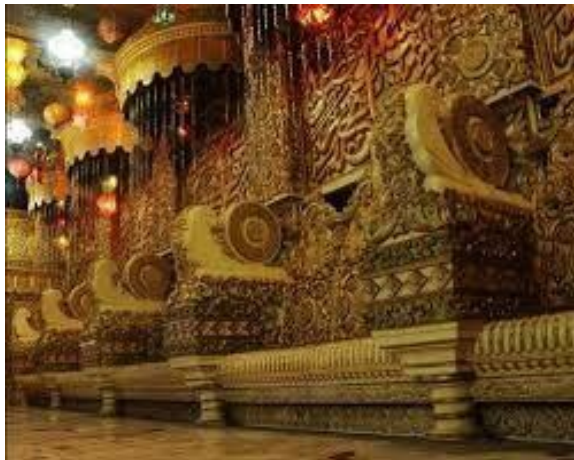
Gambar 2: Nampak ornament Bangunan pada sudut dalam PP Bihaaru Bahri Asali Fadlaailir Rahmah

Awal mulanya, masyarakat beranggapan bahwa Pondok Tiban merupakan pondok pesantren yang meresahkan karena dianggap sesat dengan dugaan yang timbul akibat keanehan-keanehan yang terjadi dalam pondok pesantren seperti pembangunan yang terus menerus sementara dananya tidak transparan. Sang kyai juga kurang bergaul dengan masyarakat, karena cenderung menyendiri dan lebih sering melakukan aktivitas di luar desa. Bahkan ada seorang tokoh masyarakat yang menyatakan dan menghimbau kepada masyarakat agar tidak pergi ke pondok pesantren Bihār Bahr ‘Asal Fadlāil al-Rahmah ini karena dianggap sebagai pondok Jin. Sempat juga muncul isu bahwa masyarakat Sananrejo akan melakukan demo untuk membubarkan pondok pesantren karena dianggap meresahkan.