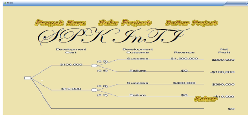
Gambar 3. Menu utama SPK InTI

Sedangkan pada sub-menu proses digunakan untuk menginput manfaat bernilai kualitatif yaitu memilih salah satu jawaban pertanyaan/kuesioner serta menganalisis kelayakan investasi TI.