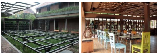
Gambar 4. Kolam untuk Pengolahan Limbah ( Recycling, Reused ) Sekaligus sebagai Panggung di Bagian Atasnya (Kiri), Restaurant dengan Material Sebagian Besar dari Kayu Bekas (Kanan)