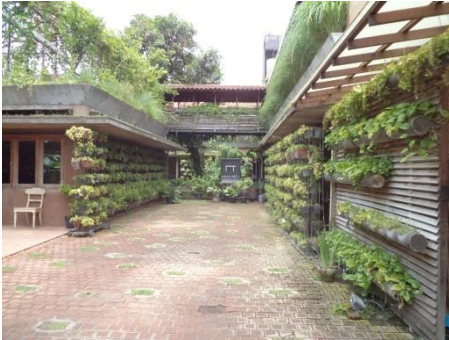
Gambar 1. Tampak Depan Rumah Turi yang Dipenuhi Vegetasi dalam Pot Gantung