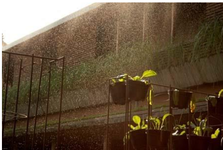
Gambar 2. Air dari Atap Sebagai Recycling dari Air Limbah untuk Menyirami Tanaman