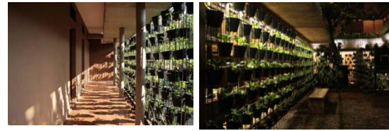
Gambar 5. Vegetasi Sayuran dalam Pot yang Dipasang di Selasar Depan Kamar Hotel, Berfungsi Juga Sebagai Shading

Selain penyelesaian masalah air dan penggunaan material interior yang umumnya memiliki prinsip recycling dan reused , Rumah Turi memberikan fenomena kenyamanan melalui aspek vegetasi yang penanamannya cukup menarik. Secara langsung memberikan view menarik dan efek termal lingkungan yang memberikan kesejukan/kesegaran.