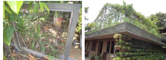
Gambar 6. Vegetasi Sebagai Atap (Kanan) dan Pagar yang Dibuat dari Paku-Paku Bekas yang Dilas