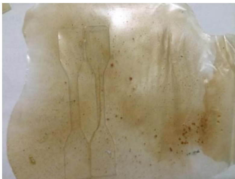
Gambar 1. Plastik biodegradable pada kondisi optimum