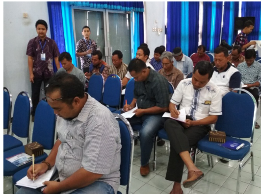
Gambar 2. Suasana saat pengisian form asesment

Tahap II dibuat kelompok-kelompok kecil yang berisikan 10-12 didampingi oleh satu fasilitator akan melakukan diskusi. Fasilitator membuka forum FGD dan membagikan angket yang berisikan pertanyaan yang gunanya untuk mengambil data tentang pendidikan seksual yang