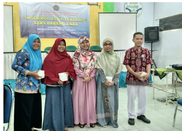
Gambar 6. Peserta terbaik berfoto bersama Kaprodi