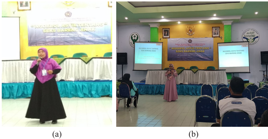
(a) (b) Gambar. 4 Presentasi materi I dan materi II

Setelah kegiatan inti selesai, di akhir sesi pengisi acara mengajukan beberapa pertanyaan rebutan yang ditujukan kepada semua peserta, hal ini dilakukan dengan tujuan seberapa besar antusias para peserta mengikuti kegiatan peserta yang bisa menjawab pertanyaan dengan tepat, lugas dan benar akan mendapat predikat peserta terbaik dan hadiah. Selain itu Kaprodi Magister Psikologi Universitas Muhammadiyah Surakarta juga menyerahkan kenang-kenangan kepada pihak SD Birrul Walidain Muhammadiyah Sragen sebagai tanda terima kasih atas kerjasama pelaksanaan kegiatan pengabdian masyarakat.