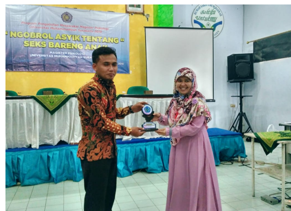
Gambar 5. Penyerahan kenang-kenangan

Hasil asesmen menjadi umpan balik dalam pelaksanaan FGD. Persepsi yang sudah dimiliki oleh setiap peserta dan hasil diskusi menjadi lengkap dengan sajian materi I dan materi II.