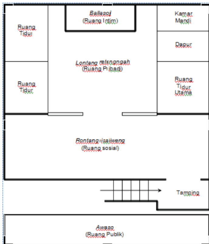
Gambar 3 Denah Penyatuan Ruang Rumah Adat Bugis

Mengadopsi empat kategori wilayah personal yang dipaparkan oleh Hall (1959) dengan konsep proksemik yang mengacu pada fungsi-fungsi ruang yang ada pada rumah adat Bugis, dengan mengubah denah menjadi tempat melaksanakan prosesi adat perkawinan Bugis. Cara yang mereka lakukan adalah menyatukan antara ruang keluarga dengan ruang makan dan ruang tamu menjadi Ballasoji (kategori ruang intim), lontang retengngah (kategori ruang pribadi), lontang risaliweng (kategori ruang sosial), dan awaso (kategori ruang publik).