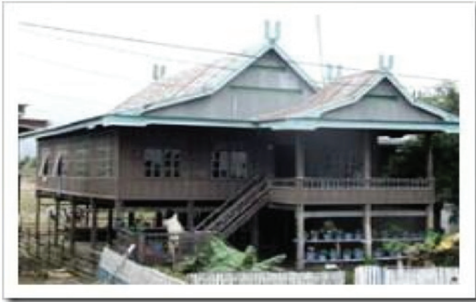
Gambar 1 Rumah Adat Bugis

menuju pada kesimpulan akhir yang mampu menjawab, menerangkan tentang berbagai permasalahan penelitian.