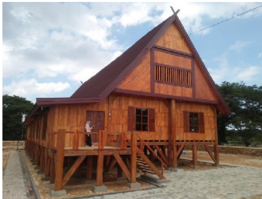
Gambar 1 Bharuga no Wuna (Rumah Adat Muna)

Berdasarkan pembagian tersebut di atas, menunjukkan bahwa penggunaan rumah mempunyai kegunaan dan kepentingan yang berbeda. Perbedaan didasarkan pada tempat atau lokasi penggunaannya. Berikut adalah gambar rumah adat Adat Muna.