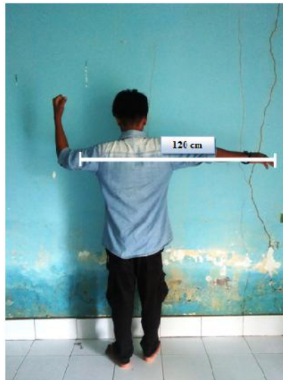
Gambar 3 Ilustrasi untuk Membuat Ukuran pada Kayu

Penentuan ukuran jarak antar titik pada tiang-tiang menggunakan sepotong kayu yang telah ditentukan ukurannya. Ukuran kayu tersebut, diukur dari ujung jari tengah tangan kiri sampai pada pertengahan lengan kanan ataupun sebaliknya (dua hasta ditambah satu setengah jengkal). Adapun untuk menentukan ukuran pada kayu dapat diilustrasikan pada gambar 3 berikut.