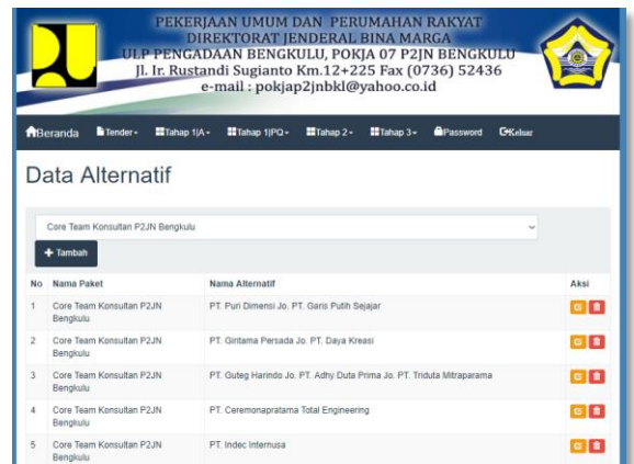
Gambar 3. Halaman Data Alternatif

Halaman data tender merupakan halaman yang bertujuan sebagai data master tender dimana terdapat data tender dan data alternatif. halaman ini yang bertujuan sebagai data master tender dimana admin dapat menginput data nama paket, nilai paket dan tahun anggaran paket.