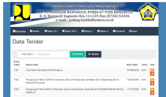
Gambar 2. Halaman Data Tender

Pada subbab ini akan dibahas mengenai implementasi antarmuka dari sistem yang telah dibuat. Pada tahapan implementasi antarmuka ini, sistem akan diimplementasikan menggunakan bahasa pemrograman PHP dan framework codeigniter .